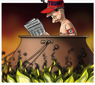
SWEN (SILVAN WEIDMANN)