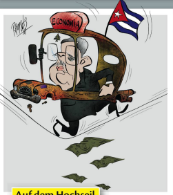
RAMON MORALES IZQUIERDO