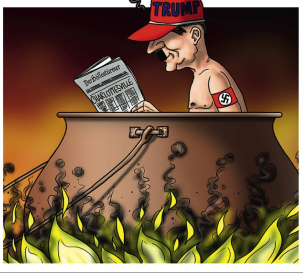
SWEN (SILVAN WEIDMANN)