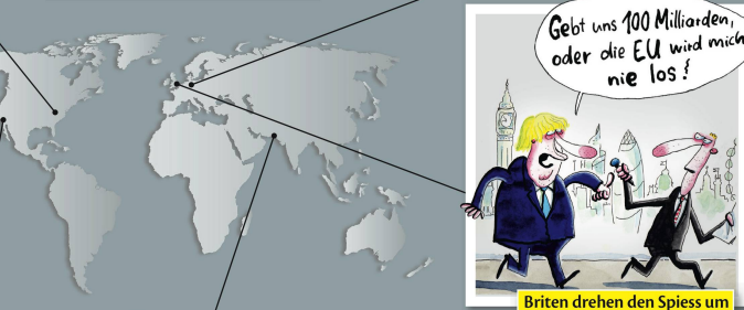
Briten drehen den Spieß um