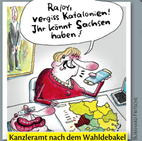
Kanzleramt nach dem Wahldebakel