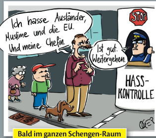
Bald im ganzen Schengen-Raum