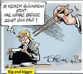
Big and bigger