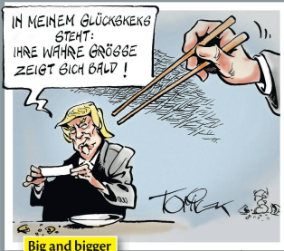
Big and bigger