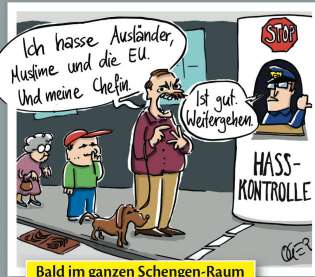
Bald im ganzen Schengen-Raum