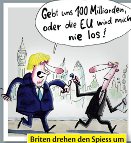
Briten drehen den Spieß um