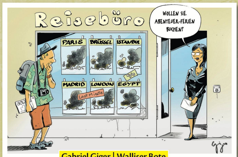
Gabriel Giger | Walliser Bote