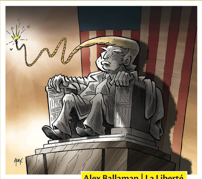
Alex Ballaman | La Liberté