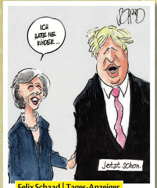
Felix Schaad | Tages-Anzeiger