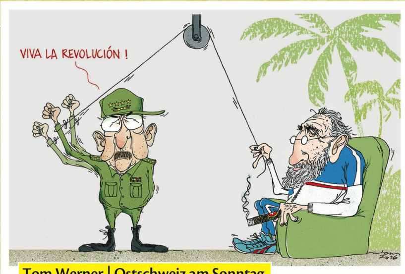
Tom Werner | Ostschweiz am Sonntag