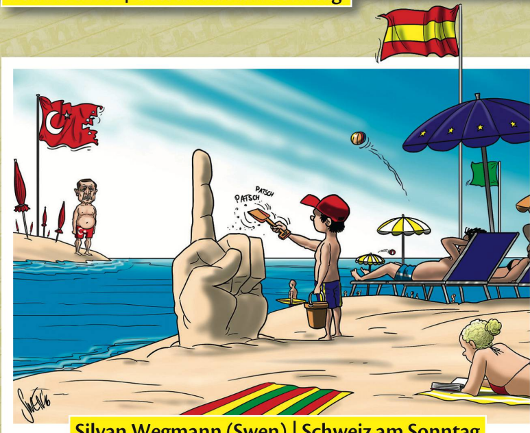
Silvan Wegmann (Swen) | Schweiz am Sonntag