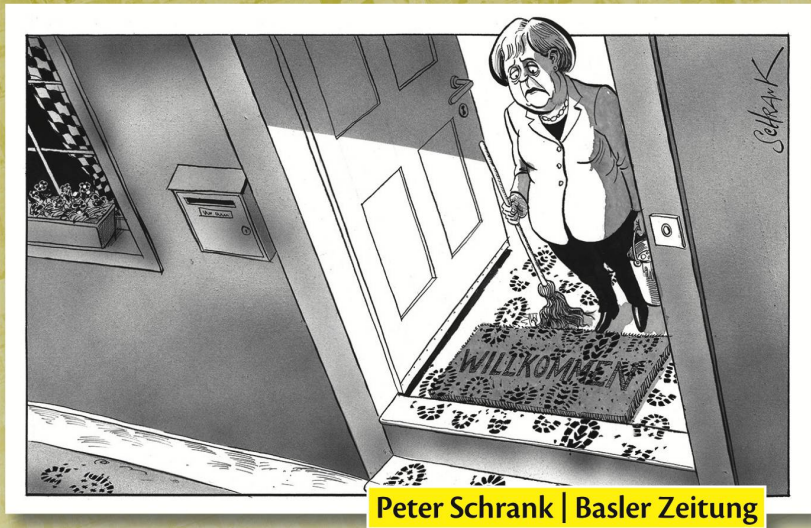
Peter Schrank | Basler Zeitung