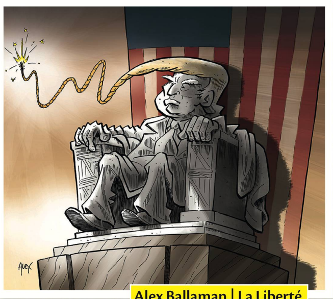
Alex Ballaman | La Liberté