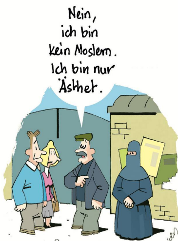
CARTOONS: KARSTEN WEYERSHAUSEN