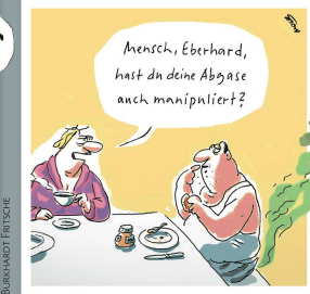
MOCKE (VORNER) KOSCHNICK