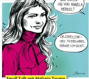
Small Talk mit Melania Trump