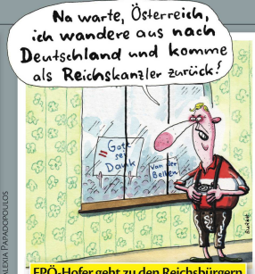
FPÖ-Hofer geht zu den Reichsbürgern