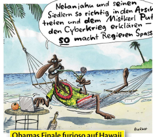
Obamas Finale furioso auf Hawaii