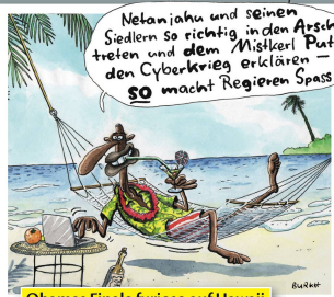
Obamas Finale furioso auf Hawaii