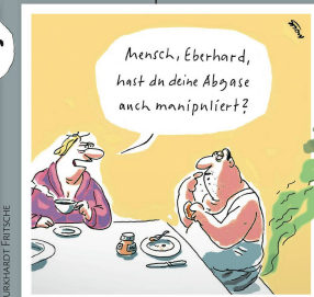
MOCKE (VORNER) KOSCHNICK