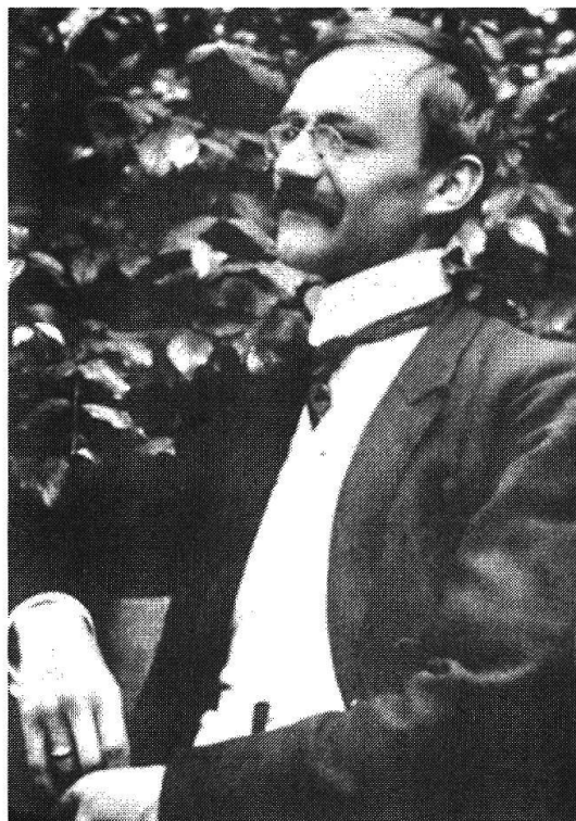
Karl Barth, 1916 in Safenwil