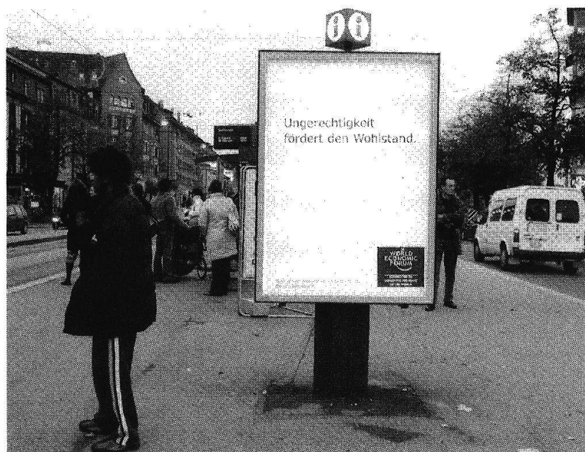
Postkartenaktion der Anti-WEF-Kampagne ( www.perspektivennachdavos.ch ).

Auf diesem Hintergrund ist zu verstehen, warum es der OeME-Kommission Bern-Stadt in kürzester Zeit und ohne grossen Aufwand gelang, für eine Petition an den Synodalrat beinahe 1200 Unterschriften zu sammeln. Dass dieses Mittel für eine Auseinandersetzung gewählt wurde, war für die Kirchenleitung ungewohnt. In der Petition wird der