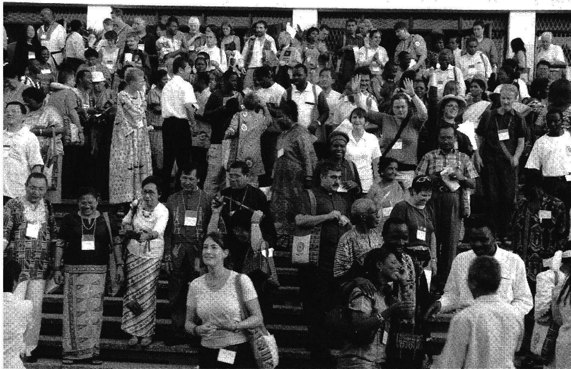
Delegierte: Die Mehrheit der Reformierten lebt im Süden.

Man kann im übrigen noch hinzufügen, dass Karl Barth nach dem Krieg ein Schulbekenntnis dafür ablegte, dass das Bekennen der Bekennenden Kirche nur