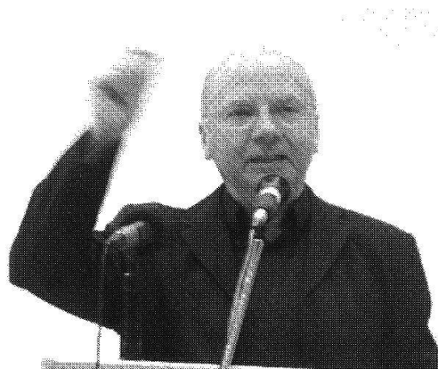
Jacques Gaillot am 4. Juni 2005 in Bern.

Gaillot erläutert seine Aussagen immer wieder anhand von Beispielen. Vor allem