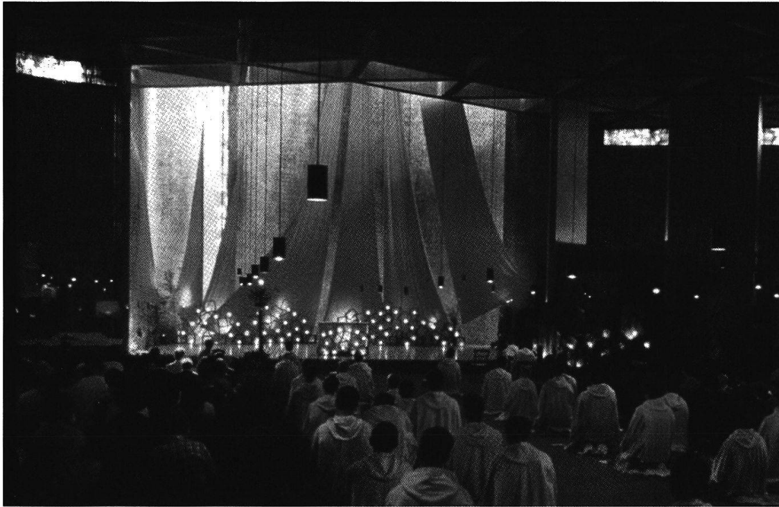
Taizé-Treffen 2004/ 2005 in der Messe- halle in Lissabon.

Während des Abendgebets in der Kirche wird vielen Pilgern das Fehlen von Bruder Roger erstmals sicht- und hörbar. Die