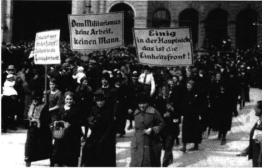
«Dem Militarismus keine Arbeit, keinen Mann.» – «Produziert nur für den Bedarf! Dann habt ihr die 4-stündige Arbeitszeit.» Frauen am 1. Mai in Zürich um ca. 1919.