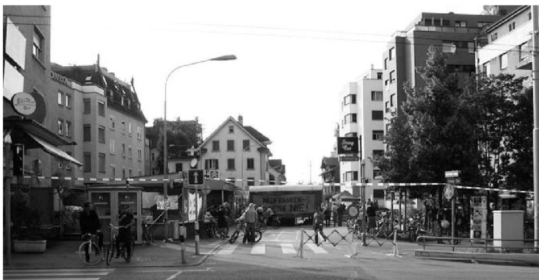
Neufrankenschneise-Markierband, aufgenommen am 16. August 2008 anlässlich des Strassenfestes zum Beginn der Kampagne «Neufrankenschneise – Nein!».

kehrsberuhigung und Quartiersanierung umgesetzt wird. In diesem exemplarischen Prozess gelang es den Behörden, die ehemals oppositionellen AkteurInnen partizipatorisch einzubinden und damit der Kritik an einer hegemonialen Stadtentwicklung und deren sozialen Konsequenzen eine historische Niederlage zuzufügen.