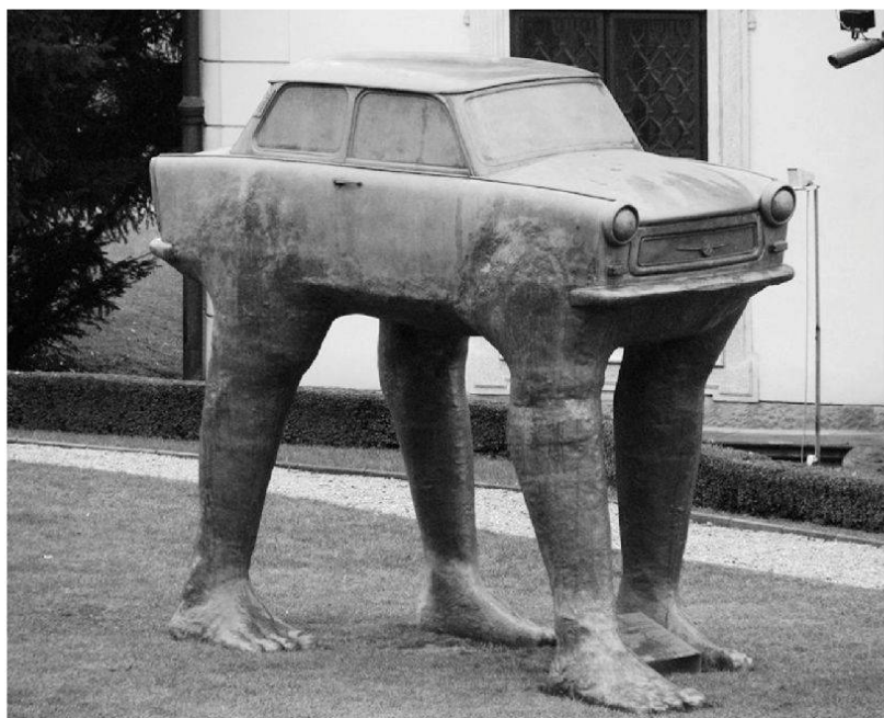
Wende-Denkmal in der Deutschen Botschaft in Prag.

Im November 1989 hatten Christa Wolf zusammen mit dem Ostberliner Generalsuperintendenten Günter Kru-