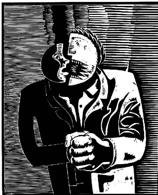
Wolfgang Matheuer: Zwiespalt, Holzschnitt zum Thema Zerissenheit, das als Auseinandersetzung mit der Spaltung Deutschlands gedeutet werden kann.

mit einem Nachbarn, der jede Schwäche, jeden Fehler ausnützen würde. Das führte beinahe zwangsläufig zur besonders nachdrücklichen Betonung des Existenzrechtes der DDR und verhinderte damit im Inneren die nötige Gelassenheit im Umgang mit Kritik und Protest. Aber genau dies musste auf die Heranwachsenden, die weder Krieg noch Nachkriegszeit erlebt hatten, negativ wirken und sie gegenüber dem Staat mehr und mehr entfremden. Als dann die DDR der westlichen Konsumpropaganda immer weniger entgegenzusetzen hatte und schliesslich auch die Hoffnung, die Gorbatschow neu belebt