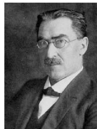
Leonhard Ragaz um 1915.

Drei Jahre später gründet Ragaz mit andern Theologen die Religiös-soziale Bewegung und die Zeitschrift Neue Wege . Bewegung und Zeitschrift vertreten immer dezidierter einen religiösen Sozialismus, dessen Kern der Glaube an den lebendigen Gott und sein Reich für die Erde ist. Der Ausblick auf das Reich Gottes weist über die Kirchenmauern hinaus in die Weltwirklichkeit . Etwa zur selben Zeit, wie Ragaz diese Worte schreibt, sagt ganz ähnlich der schwäbische Pfarrer und religiöse Sozialist Christoph Friedrich Blumhardt: Nicht dass du Christ bist, ist die Hauptsache, sondern dass Gott in der Welt ist .