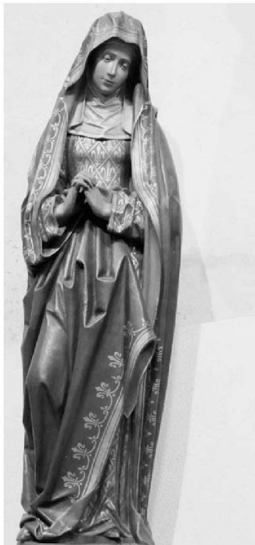
Maria, aus der Kreuzigungsgruppe des Tilman van der Burch, 15./16. Jahrhundert, in Gross St. Martin, Köln.