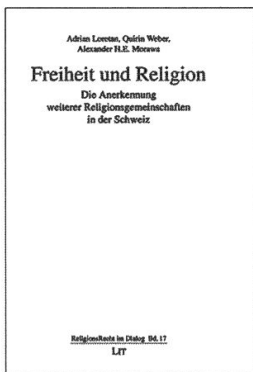
Adrian Loretan/Quirin Weber/Alexander Morava, Freiheit und Religion. Die Anerkennung weiterer Religionsgemeinschaften in der Schweiz, Berlin 2014.