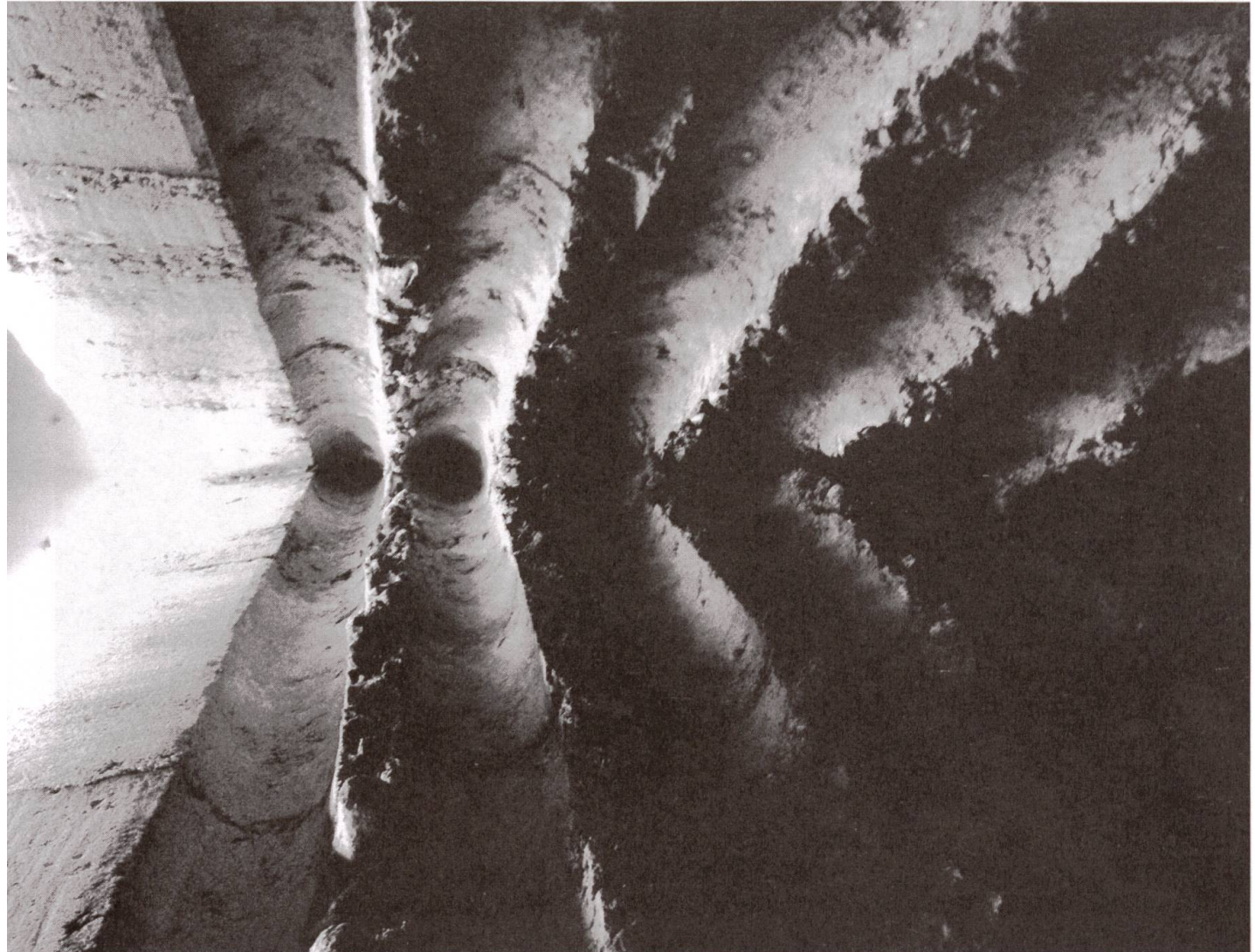
Abdruck von Fichtenstämmen im Stampfbeton beim Eingang der Bruder-Klaus-Kapelle.

2. Juni 2016 auch von Menschenrechten. Aber er setzt dann einen ganz anderen Akzent: «Die Schweiz ist ein christliches Land. Dazu sollten wir wieder stehen. Und wir sollten klarmachen, dass wir bereit sind, dieses Erbe zu verteidigen. Wer bei uns lebt, muss lernen, diese christlichen Werte anzuerkennen.» Was halten Sie von dieser Verwendung der «christlichen Werte», die zu einem Kampfbegriff gegen andere werden?