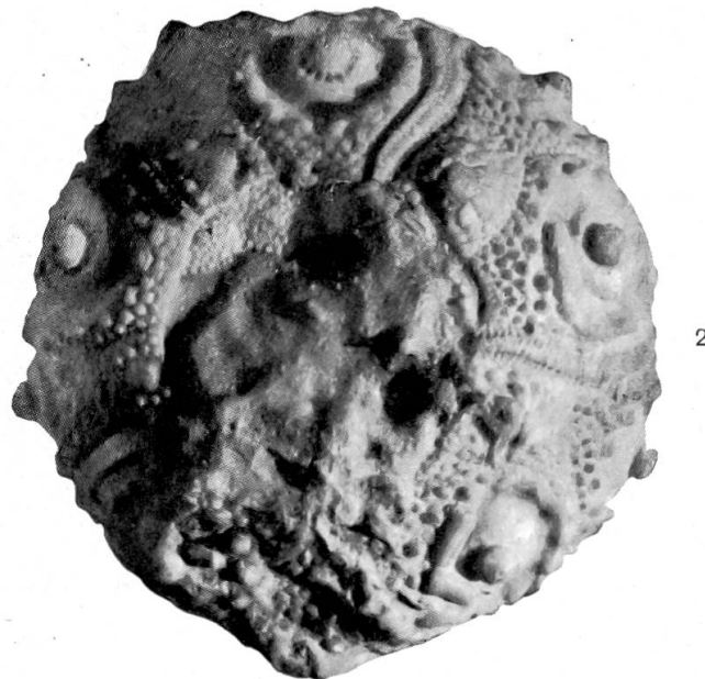
Fig. 1. Cidaris Parandleri Ag. von oben. Nat. Grösse.