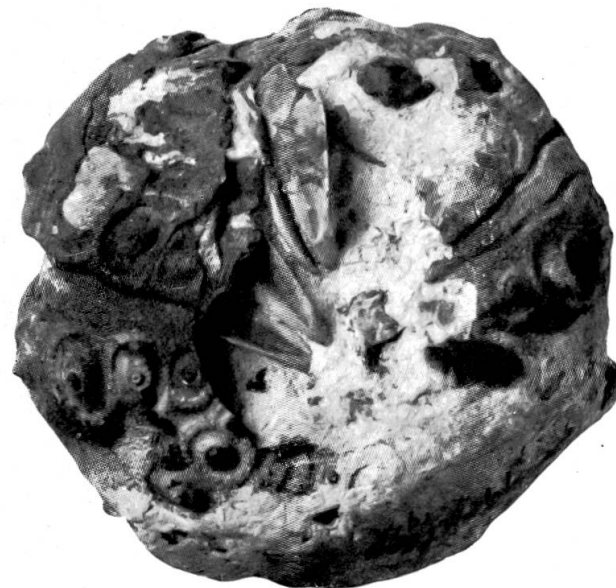
Rhabdocidaris nobilis, Münster mit Gebiss, 7/8. Steinbruch Mellikon, oberster Horizont. Sammlung Leuthardt.