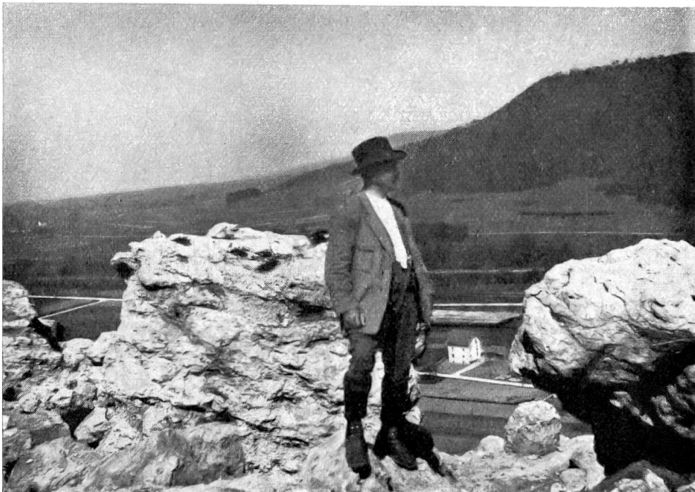
Steinbruch von Mellikon. Verkarstete oberste Malmschichten.

Die über den wohlgeschichteten Kalken liegenden glaukonitführenden (6) Schichten mit ihrer reichen Spongien- und Brachiopodenfauna gehören dem untern Kimmeridge an (= Crussolien Rollier = Badenerschichten Moesch. = Tenilobatusschichten, Oppel = Weisser Jura \gamma Quenstedt). Sie sind weniger gut gebankt und viel tonhaltiger als die Wangenerschichten.