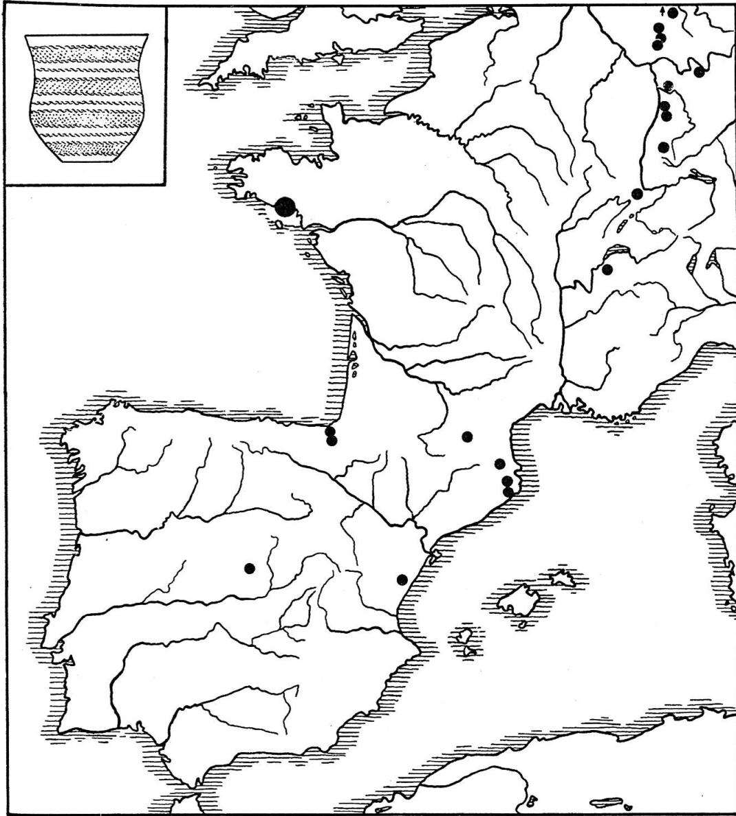
Karte. Verbreitung der Glockenbecher mit schnurfassten Schrägstempelzonen.

zogen werden, wobei lediglich eine mittlere Schnur noch die ursprüngliche Trennung der Zonen versinnbildlicht. Gute Beispiele der letzteren Art bilden einmal der Becher von Huttenheim (Kreis Bruchsal) 4) , dessen