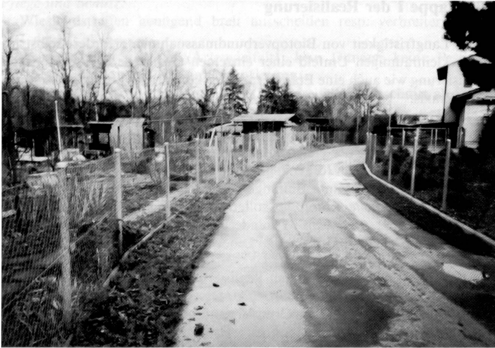
Abb. 16: «Geputzter» Wegrandbereich in der Familiengartenzone: Ideal zur Anlage eines extensiv bewirtschafteten, artenreichen Wieslandstreifens (Westplateau – Paradieshofweg).

Die Vorstellungen über diese erste Realisierungsetappe sind in der Originalarbeit als Planbeilage (Plan Nr. 2) schematisiert dargestellt. Der Zeitraum für diese erste Umsetzungsperiode ist mit rund 5 Jahren zu veranschlagen.