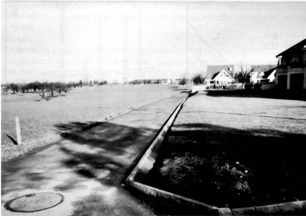
Abb. 17: Fast fehlendes Wegbankett (links): Zur Anlage eines extensiven Wieslandstreifens geeignet. Sterile (Privat-)Rasenfläche (rechts): Ungenutzte Chance zur Anlage naturnaher Bereiche am Siedlungsrand und innerhalb des Siedlungsbereichs (Verzahnung Landschafts-, Baugebiet; Westplateau – Drissel).

So wurde beispielsweise streng darauf geachtet, dass ein möglichst grosser Teil der wünschbaren und ökologisch begründeten Anforderungen planerisch erfüllt wird (z. B. maximal tolerierte Überbrückungsdistanzen; Hecken-dichte pro km 2 ; Ästhetik etc.; vgl. Kap. 3 + 4).