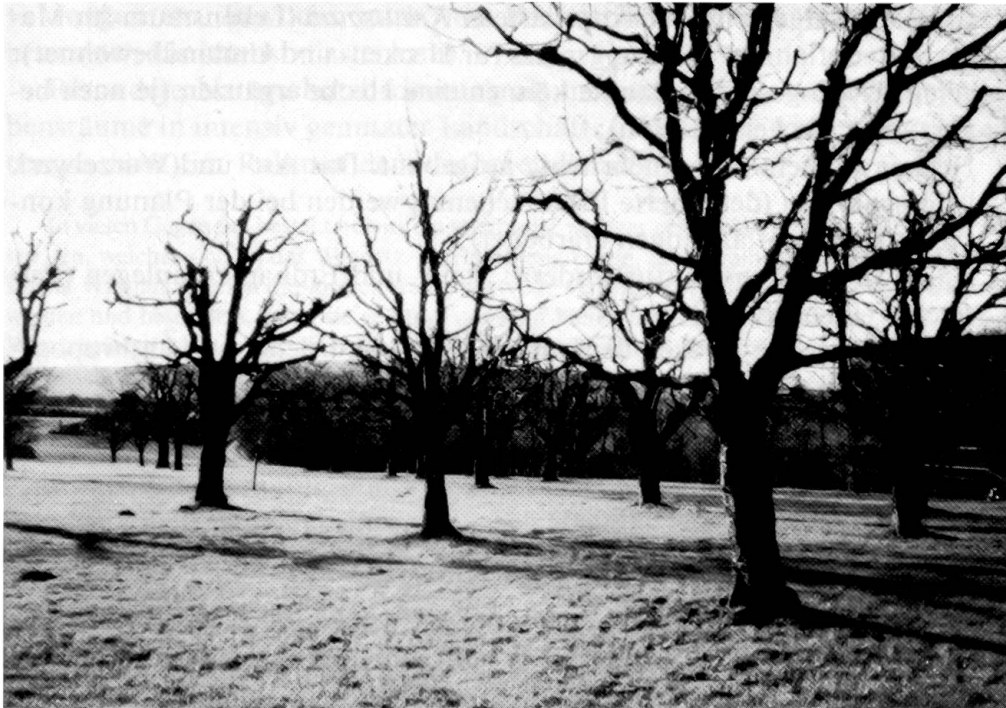
Abb. 13: Wertvoller, schutzwürdiger Streuobstbestand (Westplateau – Dreieck).

hohem Anteil an räuberisch und/oder parasitisch lebenden Arten (Schädlingsregulierung). «Wanderkorridore» (Ausbreitungsachsen) im Rahmen der Biotopvernetzung.