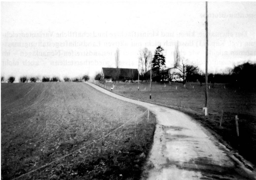
Abb. 14: Asphaltiertes Feldsträsschen mit minimalem Bankett: Bewirkt ökologische Isolation (Westplateau – Paradies).