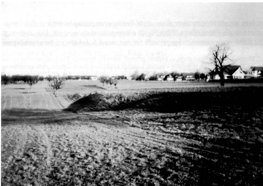
Abb. 15: Bestehende Geländekante (ehemalige Lehmgrube): Zur Anlage eines «Trittstein-Biotops» prädestiniert (Strauchgruppe o. ä.; Westplateau – Leimgrubenmatten).

Priorität erhält in dieser ersten Realisierungsphase ausserdem ein Netz extensiv bewirtschafteter Wieslandstreifen : Dessen Anlage ist einfach, kostengünstig und für die betroffenen Grundeigentümer und -bewirtschafter wenig einschneidend. Insbesondere können extensive Wieslandstreifen rasch – innert weniger Jahre – zu reichhaltigen und ökologisch wertvollen Ersatz-Lebensräumen auswachsen, sofern Anlage und Unterhalt fachgerecht erfolgen.