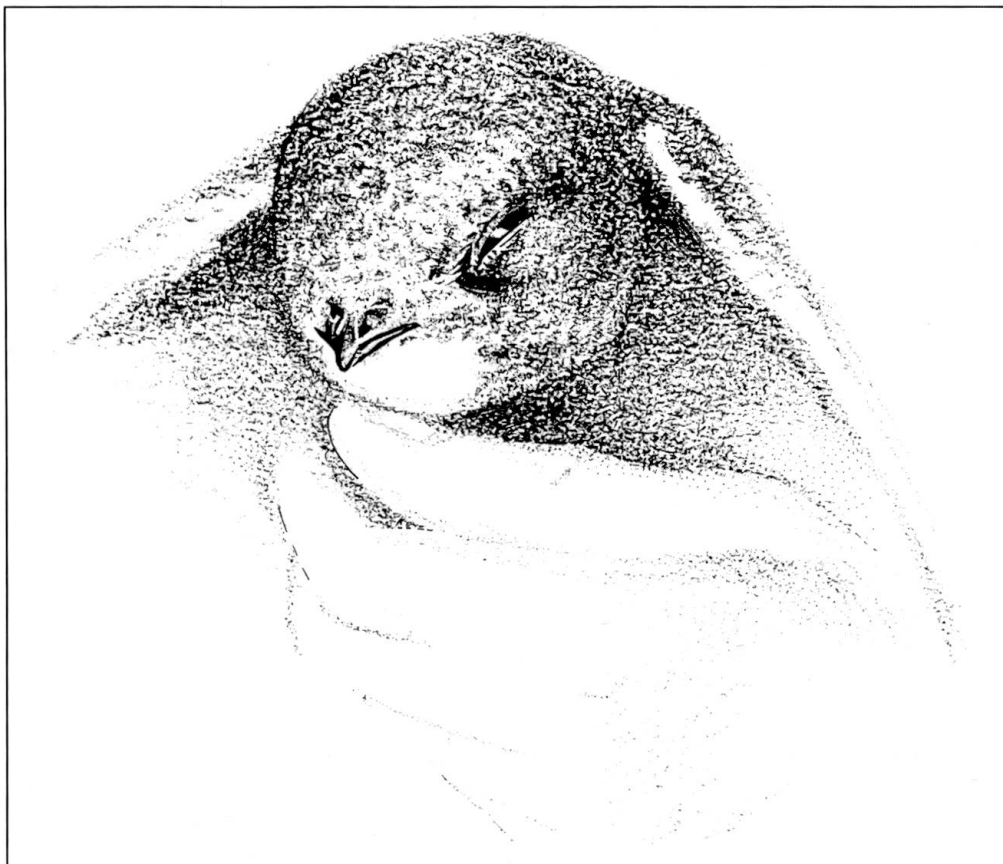
Abb. 4: Dieser Vogel ist während der Augenuntersuchung schläfrig geworden; siehe Text.

Der Lidrand des Seglerjungens sieht feucht aus, desgleichen die Hornhaut. Tränenflüssigkeit wird also produziert. Nach den Tränenpunkten haben wir nicht gesucht; bestimmt sind solche vorhanden. Ober- und Unterlidrand verlaufen fast genau horizontal, zueinander parallel (Abb. 5a). Hier schliesst der Vogel die Lidspalte von unten nach oben (Abb. 5b); auch das Umgekehrte kommt vor; der Vogel kann auch die geschlossene Lidspalte langsam hinauf und hinunter bewegen. Das Lidgewebe ist dünn. Durch das Lid hindurch sieht man die Form des Auges durchmodelliert. Es fehlte ein regel-