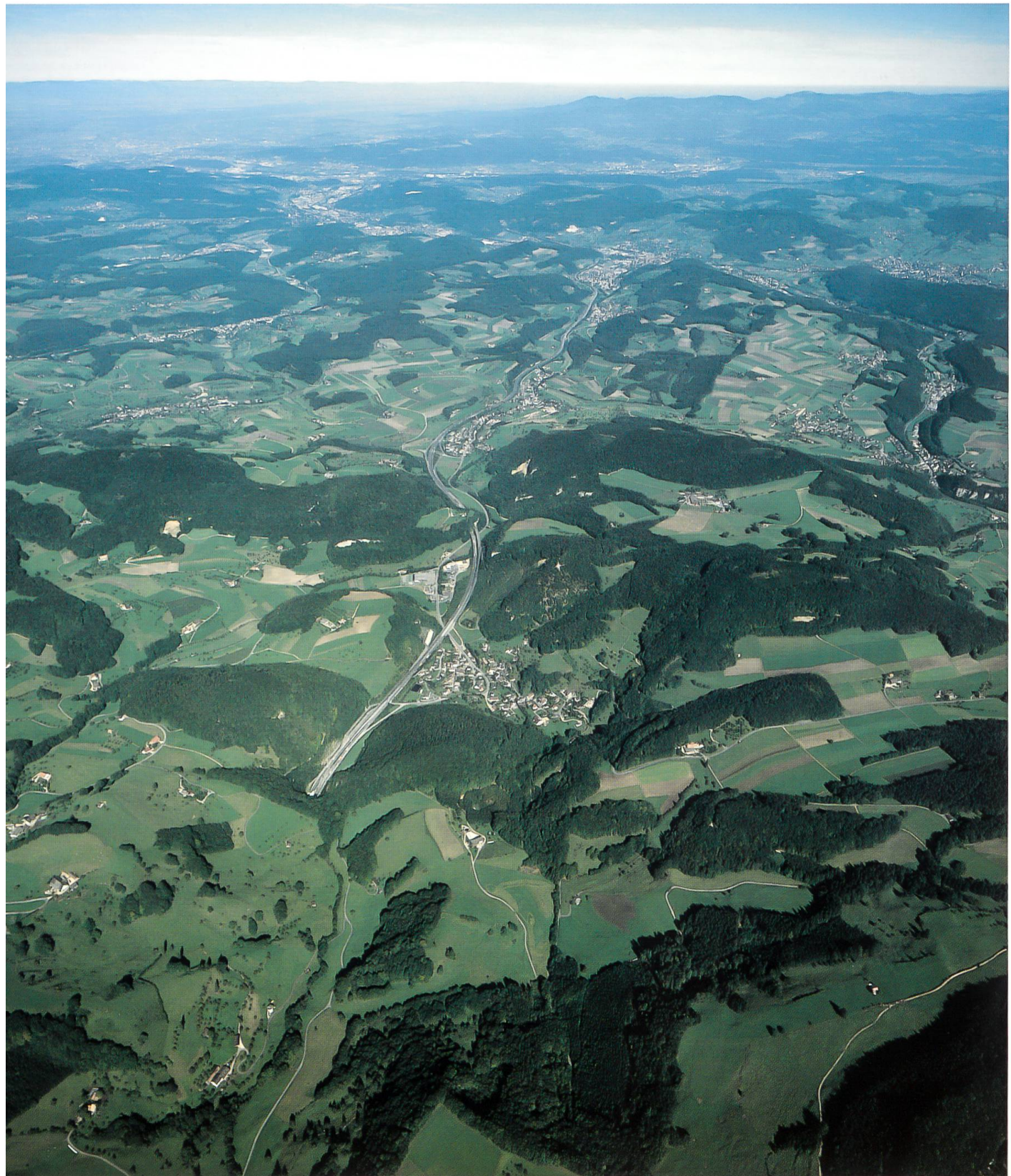
Abb. 4. Das Belchengebiet im Vordergrund zeigt einen typischen Ausschnitt aus dem Baselbieter Kettenjura. Die Jurafalten sind grösstenteils mit Tannen-Buchenwald bedeckt, in den offenen Flächen herrschen extensive Weiden vor. Die Autobahn A2 führt vom Tunnelportal bei Eptingen nordwärts in den Tafeljura. Dessen Plateaus werden intensiv landwirtschaftlich genutzt, die Talflanken sind mit Buchenwald bestockt, der Talgrund besiedelt (Photoswissair, 15. September 1997).