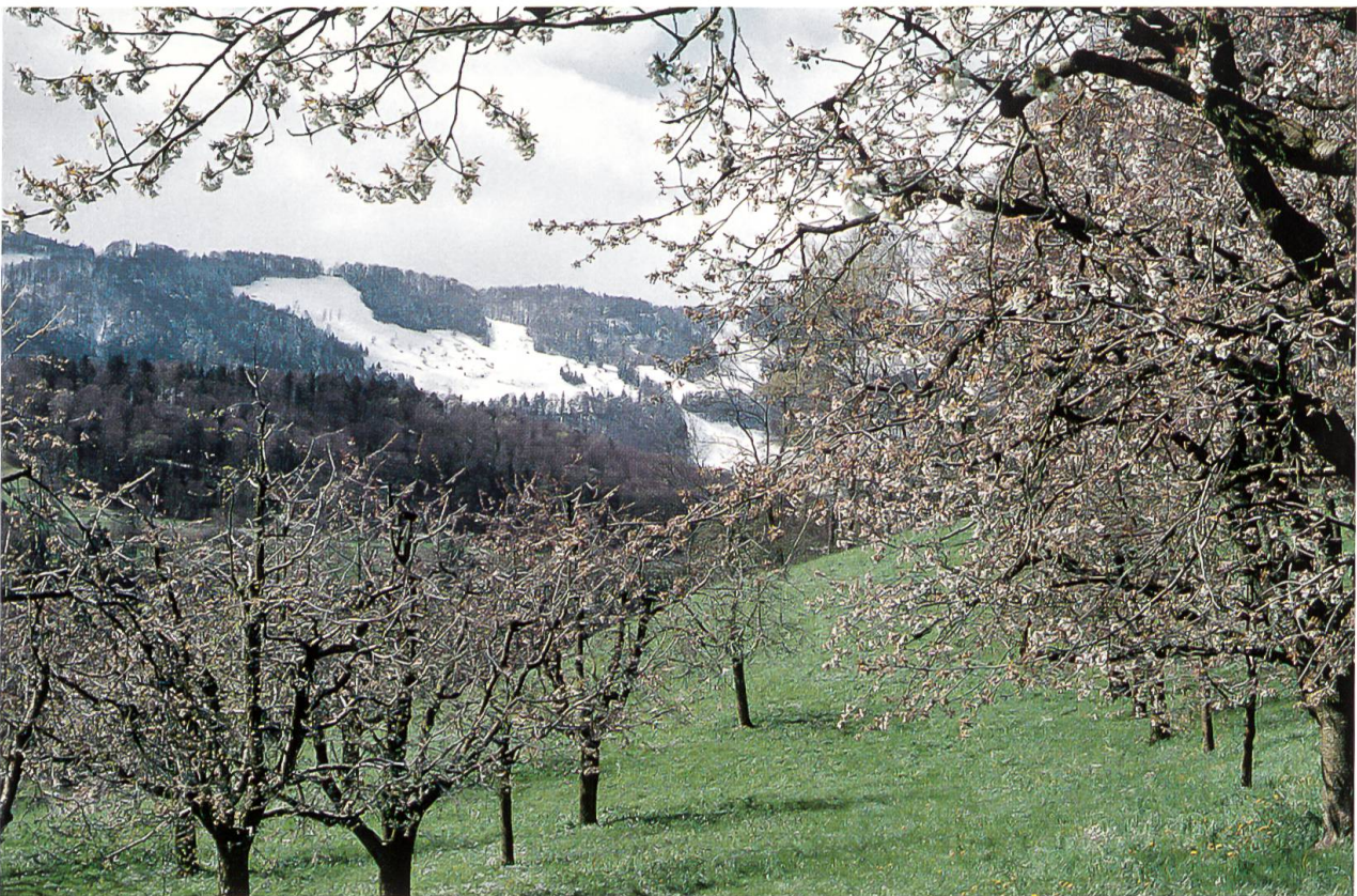
Abb. 2. Im Frühling zeigt sich der Einfluss der Höhenstufe auf die Vegetationsentwicklung besonders gut. Während auf 600 m schon die Kirschbäume blühen, liegt auf den Jurahöhen im Passwanggebiet noch Schnee (Reigoldswil, April 1999. Foto M. Kestenholz).

Weiterführende Beschreibungen von Geologie, Klima und Vegetation des Untersuchungsgebietes liefern Bitterli-Brunner (1987), Brodtbeck et al. (1997, 1998), Hufschmid & Schläpfer (1998) und Imbeck (1989).