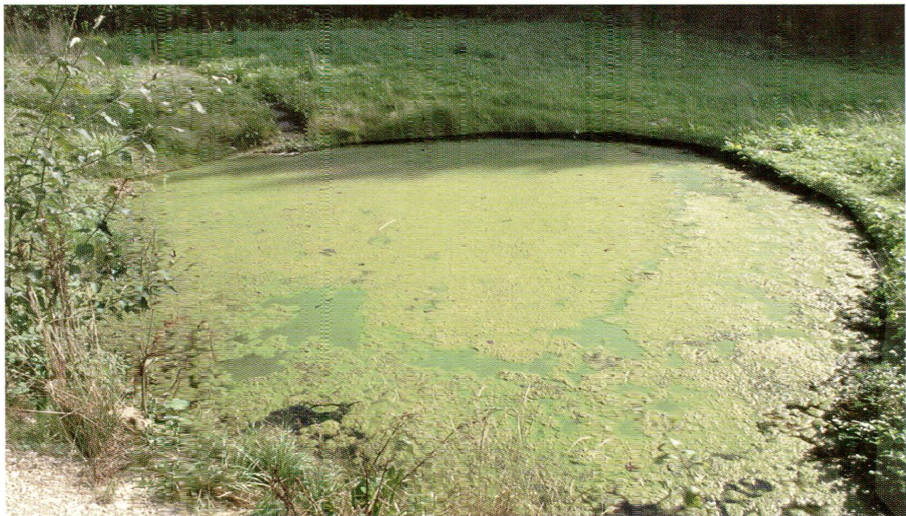
Abb. 5: Luxmattweiher mit seinen in der Untersuchungsperiode typischen «Blüten» aus fädigen Grünalgen. Das Ufer ist von einer typischen, krautigen Ufervegetation bestanden.