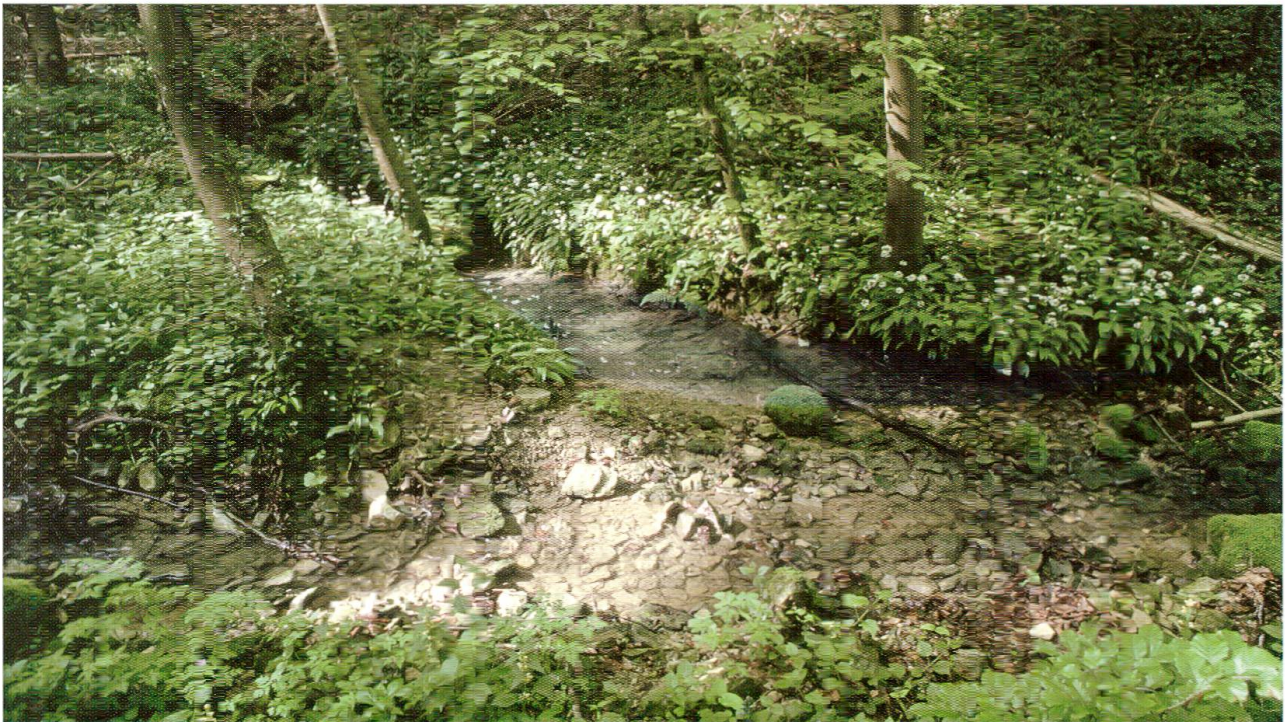
Abb. 2: Wildensteinerbach mit Zufluss einer Quelle, die wenige Meter neben dem Hauptgewässer entspringt.