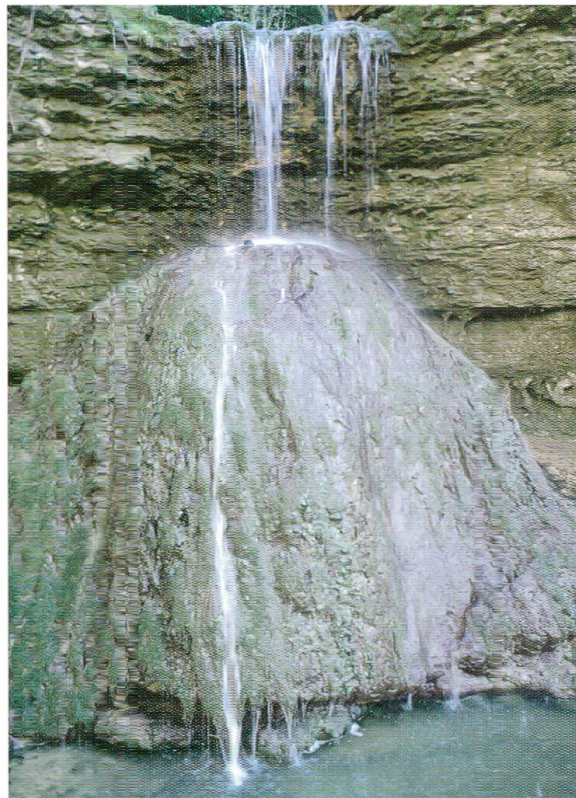
Abb. 3: Wasserfall des Sormattbächli. Der Kegel auf der tieferen Ebene besteht aus Kalksinterablagerungen, die auf einen grossen Anteil an Quellwasser hinweisen. Wenn das zuvor im Kalkgestein versickerte Wasser wieder zutage tritt, fällt der bei der Versickerung gelöste Kalk wieder aus.