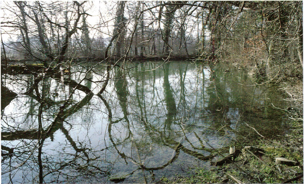
Abb. 4: Wildensteinweiher mit seinem typischen Baumbestand im Uferbereich. Eine eigene Kraut- und Staudenvegetation fehlt.