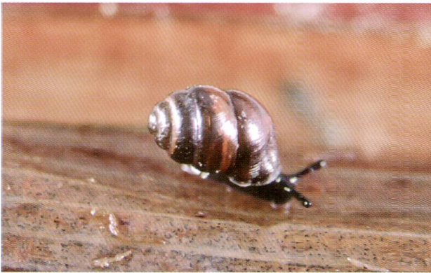
Abb. 2: Sumpfwindelschnecke ( Vertigo antivertigo ).