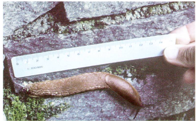
Abb. 3: Spanische Wegschnecke ( Arion lusitanicus ).

ten nachgewiesen werden. Dies ist ein eher dürftiges Ergebnis. In einer gut besonnten, ungestörten und nicht bekletterten Felsfluh im Baselbiet findet man sonst wesentlich mehr Arten (Oberer und Krumscheid 1998b). Die Zusammensetzung der Malakozönose entspricht der Situation in einem schnell zuwachsenden Felsbiotop. Bemerkenswert ist, dass von den drei Grasschneckenarten der Gattung Vallonia nur die häufigste, Vallonia costata , gefunden wurde. Normalerweise finden sich in einem ungestörten Biotop zwei oder drei Arten dieser Gattung nebeneinander (Hofer 1998).