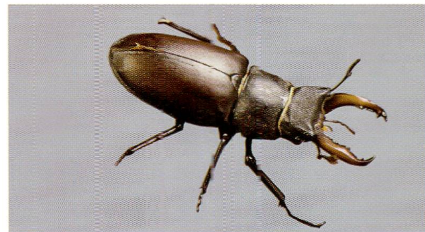
Abb. 7: Der einzige im Jahr 2000 beobachtete Hirschkäfer, ein kleines Männchen.