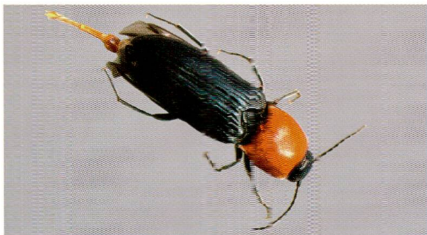
Abb. 4: Bluthals-Schnellkäfer, Ischnodes sanguinellus , in typischer Bewohner von Morschholz.