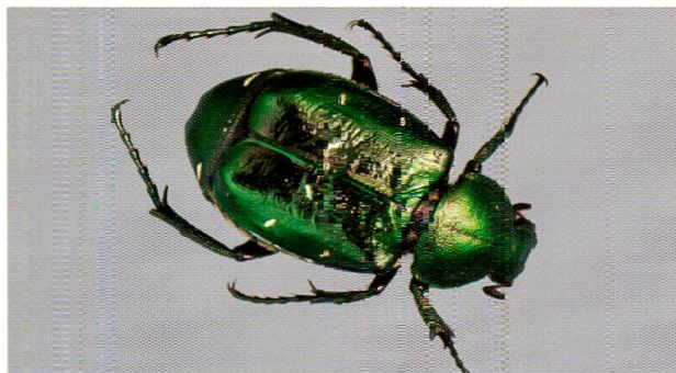
Abb. 6: Der Edelkäfer, Gnorimus nobilis , seine Larve entwickelt sich im Mulm alter Bäume.