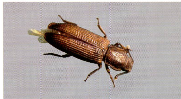
Abb. 5: Der Dornschielen-Rindenkäfer, Pycnomerus terebrans , einer der seltensten Rindenkäfer Europas.