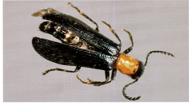
Abb. 3: Weibchen des Holzbuntkäfers, Tillus elongatus . Die Art jagt im Holz andere Käferarten.