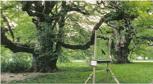
Abb. 2: Fensterfalle beim Standort 12.