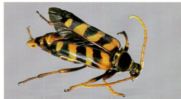
Abb. 9: Der Goldhaarige Halsbock, Leptura aurulenta : er zählt zu den Blütenbesuchern.