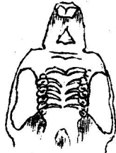
Puschlaver Maus Mus poschiavinus Fatio (Nach Fatio)