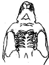
Zwei vom Typus abweichende Formen von Mus poschiavinus.