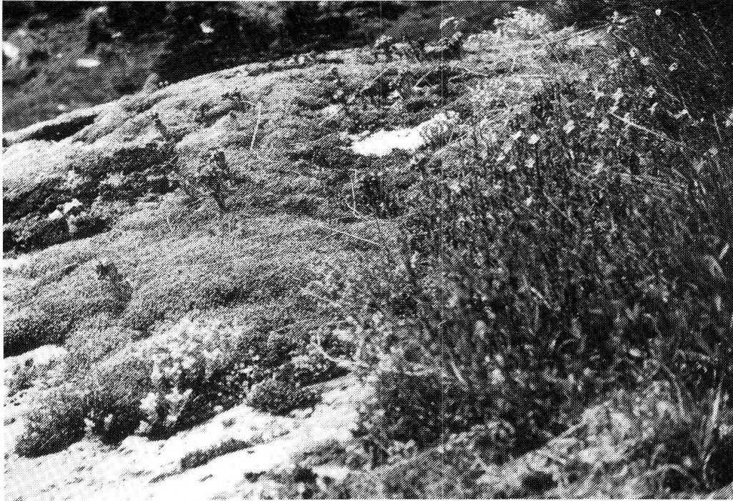
Silikat-Rundhöcker im Val Punteglias ob Trun, mit Rhacomitrium canescens , Sedum album , Sempervivum arachnoideum , Veronica fruticans , Poa alpina etc.

via pratensis , Erigeron acer , E. canadensis , Crepis capillaris als Trennarten zugeflossen.