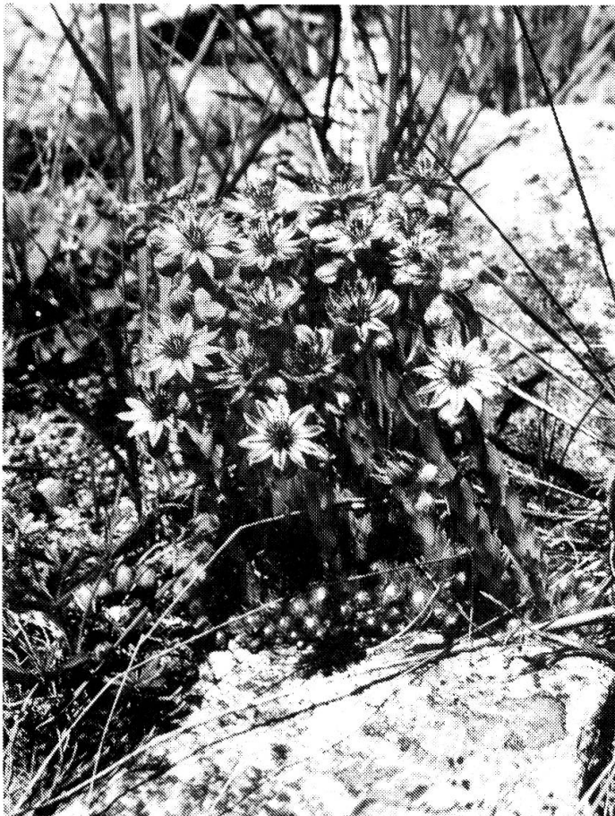
Gruppen der Spinnwebigen Hauswurz ( Sempervivum arachnoideum ), verleihen der Gesellschaft zur Blütezeit einen ganz besonderen Reiz.

Zufällige, ein oder zweimal angetroffene Arten der neun Aufnahmen: