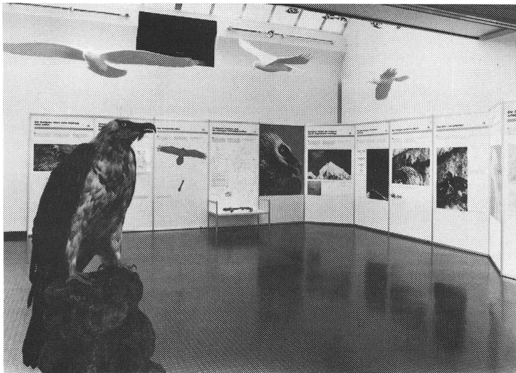
Die Sonderausstellung «Der Bartgeier» war Teil einer Informationskampagne, die der Wiederansiedlung des Bartgeiers in Graubünden vorausging.

Wesentlich kleiner als die beiden genannten Eigenproduktionen war die Ausstellung « Von der Maus bis zum Kaninchen », welche im Dezember 1988 zusammen mit dem Graubündner Tierschutzverein realisiert wurde. Sie orientierte über die