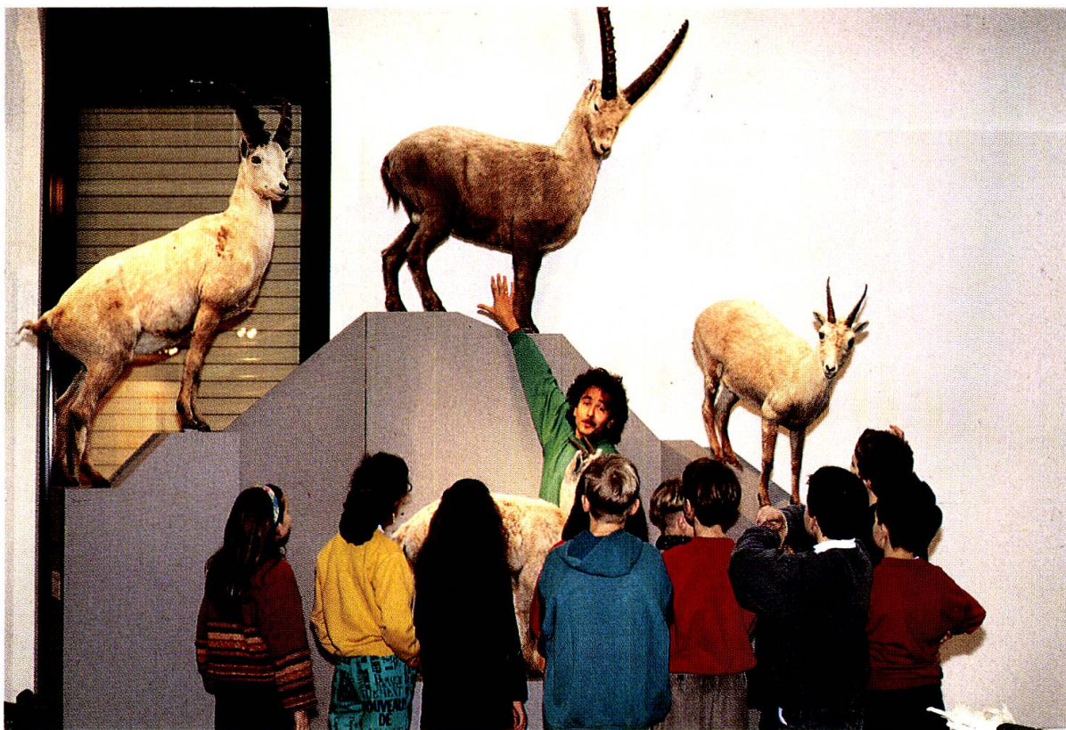
Der Museumspädagoge vermittelt den Klassen aller Stufen einen vertieften Kontakt zu den Objekten und Inhalten der Ausstellungen.

Zugang zum Museum zu vereinfachen und Möglichkeiten aufzuzeigen, wie die fast unerschöpflichen Ressourcen des Museums für die Naturkunde und Naturbetrachtung genutzt werden können. Der Museumspädagoge betreut die Lehrkräfte, bereitet sie auf den Museumsbesuch vor oder führt gezielte Aktionen mit Klassen aller Stufen durch. Der Museumspädagoge arbeitet mit den Lehrkräften eng zusammen, versteht sich aber nicht als Lehrerersatz, der die Klassen an der Museumspforte übernimmt und zur Entlastung des Lehrers oder der Lehrerin während einer oder zwei Stunden durchs Museum führt. Die Museumspädagogik wurde als neue Dienstleistung von den Lehrkräften sehr begrüsst und entsprechend benutzt. Zudem gehören die Betreuung des Auskunftsdienstes, die Mitarbeit bei der Lehrerfortbildung sowie die museumspädagogische Begleitung der Sonderausstellungen zu den Aufgaben des Museumspädagogen.