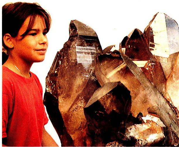
Die neu angekaufte Rauchquarzstufe aus Vals bildet eine wichtige Ergänzung der Mineralienausstellung.

In der Berichtsperiode wurde mit der Erarbeitung eines Konzeptes für die erdwissenschaftlichen Sammlungen begonnen. Das Grobkonzept muss in den kommenden Jahren noch verfeinert werden. Definiert wurden insbesondere die verschiedenen Sammlungstypen. Ein Schwerpunkt des Sammelns liegt bei der Dokumentation der grossen Tunnelbauten Graubündens.