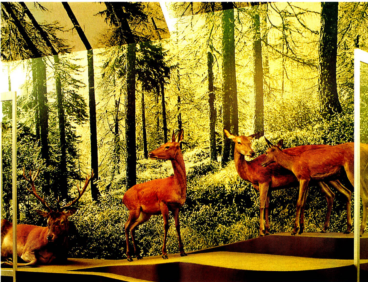
Die neue Rothirschgruppe im Erdgeschoss. Präparation: U. Schnepf und Mitarbeiter, Hintergrundgestaltung: K. Kunz, Bauten: Hj. Bardill und Ralph Feiner.

Auf grosser Fahrt waren die Ausstellungen, welche das Museum in den Vorjahren pro-