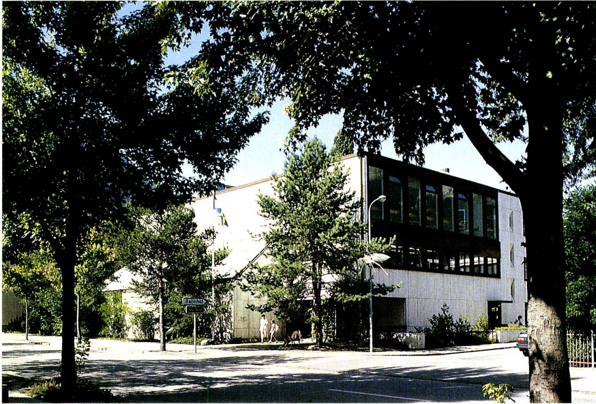
Das Bündner Natur-Museum, erbaut von 1977 bis 1980, ist mittlerweile von viel Grün umgeben.