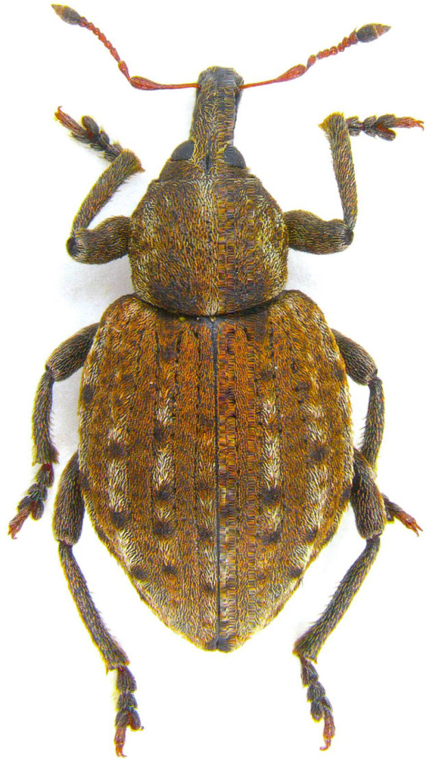
Abb. 9: Imago von Donus segnis : An den erhabenen ungeraden, weiss-beschuppten Zwischenräumen ist die Art gut zu erkennen (Foto: Christoph Germann).