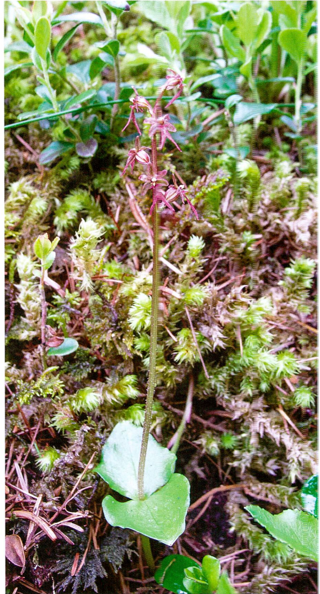
Abb. 5: Kleines Zweiblatt Listera cordata , Pra da Vau.