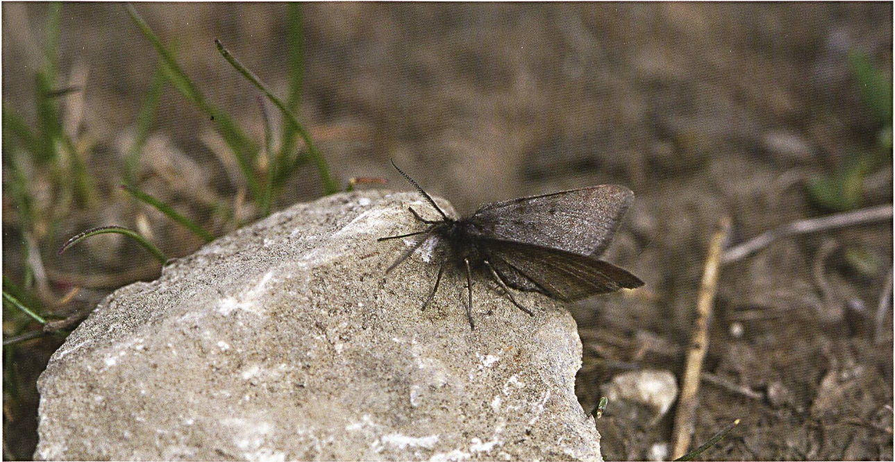
Abb. 13: Der hochalpine Zwergspanner Pygmaena fusca konnte im Untersuchungsgebiet als Raupe auf dem Silberwurz sitzend gefunden werden.

chen, so dass die hier erarbeitete Liste mit 17 Arten keinesfalls als abgeschlossen gelten kann.