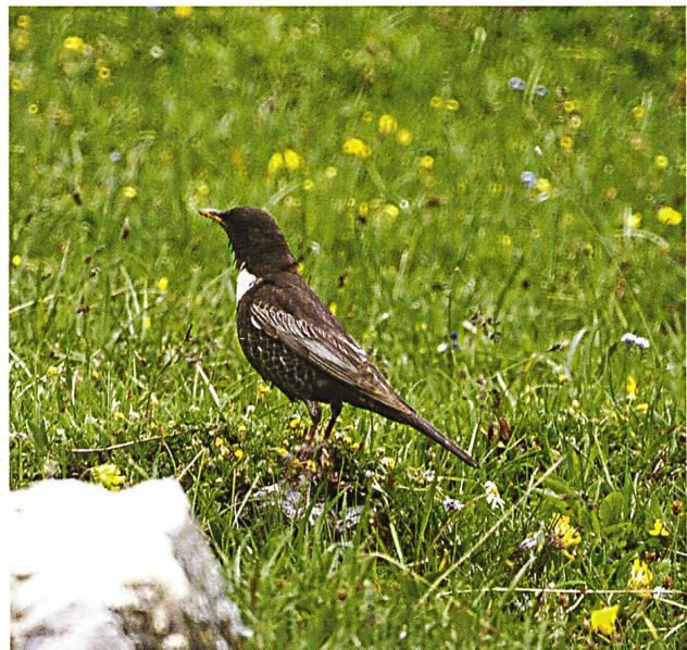
Abb. 16: Die Ringdrossel Turdus torquatus besiedelt die Waldgrenze und geht tendenziell zurück. In der Val Vau/Val Mora wurde sie an verschiedenen Orten festgestellt.

Die meisten der in den vorhandenen Lebensräumen erwarteten verbreiteten Arten konnten nachgewiesen werden (Tab. 13: Nachgewiesene