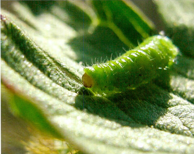
Abb. 8: Larve von Donus segnis auf Geranium sylvaticum bei Spi da Vau (Foto: Christoph Germann).