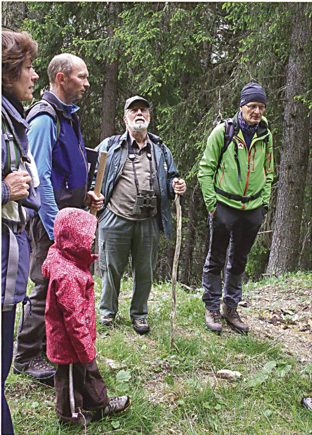
Abb. 20: Interessierte Teilnehmende an der Exkursion in den Wald.

an einem Ort. Dies bietet die Möglichkeit, sich zu vernetzen und auszutauschen. Dabei finden auch Kontakte über die Artengruppen hinweg statt.