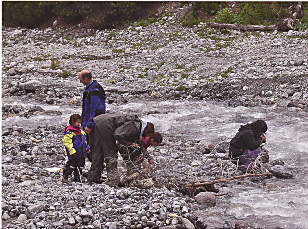
Abb. 19: Familien als Bachforscher (Foto: UNESCO Biosfera Val Müstair Parc Naziunal).