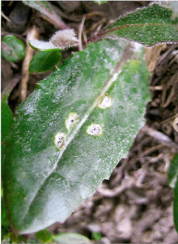
Abb. 11: Der typische Lochfrass der Imago von Microplontus fairmairii in den Blättern von Senecio doronicum.

reits ein Vorkommen von D. segnis : «Diese Art ist in der Schweiz noch nicht aufgefunden, dürfte aber kaum fehlen, da sie in Tyrol nicht selten ist.» 115 Jahre später kann diese Vermutung bestätigt werden.