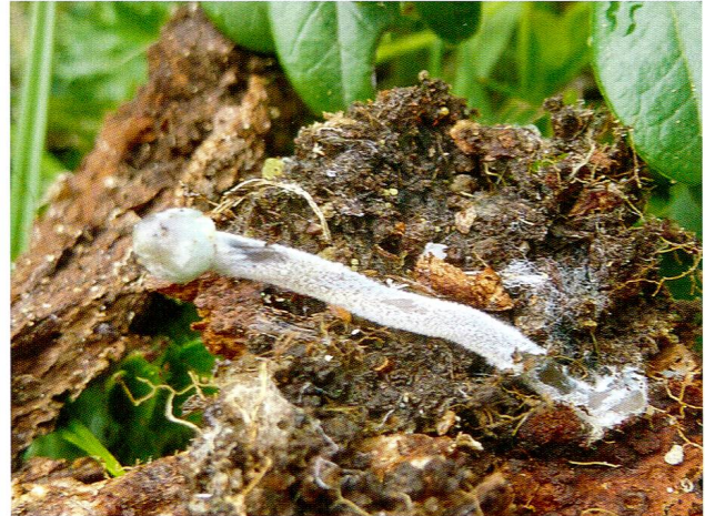
Abb. 3: Mycena amicta.

Es ist jedenfalls ein Vielfaches der Blütenpflanzenarten. Wegen der spärlichen Sammeltätigkeit sind noch keine Aussagen über die wirkliche Häufigkeit von jenen Pilzen möglich, die mit nur wenigen oder keinen Angaben auf der Liste der WSL angeführt sind, zum Beispiel einige der Dungpilze. Viele kleine Ascomyceten finden sich auf abgestorbenen Pflanzenresten, einige sind spezialisiert auf einzelne Gattungen oder sogar Arten, andere haben ein grösseres Spektrum von Wirten. Ebenso gibt es eine Reihe von echten Parasiten. Manche höhere Pflanze dient mehreren Pilzen als Substrat. Es wird dabei angenommen, dass die Verbreitung der Wirtspflanzen oft mit der Verbreitung der dazugehörigen Pilze übereinstimmt. Neben den Ascomyceten befinden sich in der Aufsammlung auch wenige Vertreter der Myxomyceten (die ebenfalls relativ spärlich auf der WSL-Liste zu finden sind) und der Basidiomyceten . Die am GEO-Tag gesammelten Pilze befinden sich im ETH-Pilzherbarium. Es ist gut möglich, dass kritische Nachbestimmungen von Wissenschaftlern bei dieser oder jener Art zu etwas anderen Resultaten gelangen.