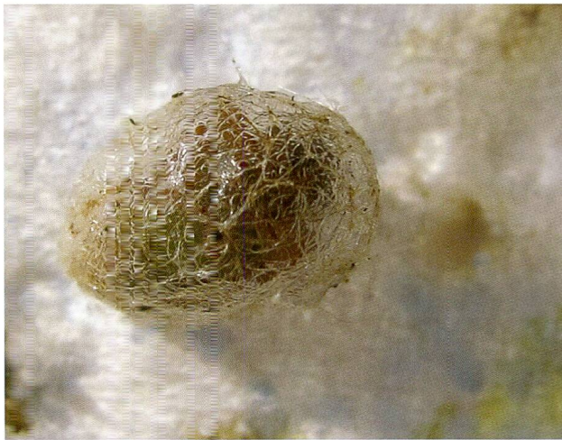
Abb. 10: Der typische Gitterkokon von Donus segnis.