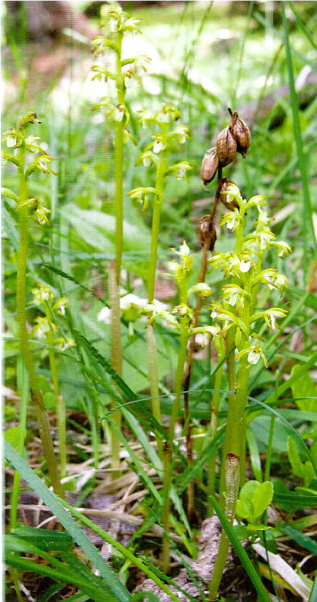
Abb. 4: Europäische Korallenwurz Corallophiza trifida mit Fruchtstand vom Vorjahr, Val Vau, Plaun da la Motta.