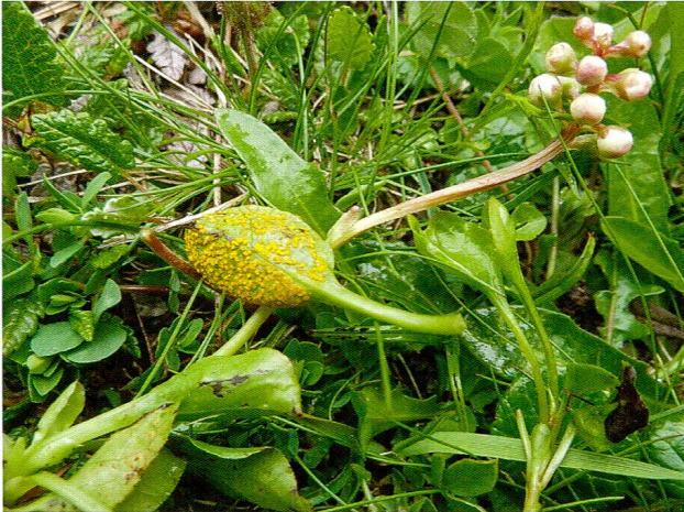
Abb. 2: Pucciniastrum pyrolae.