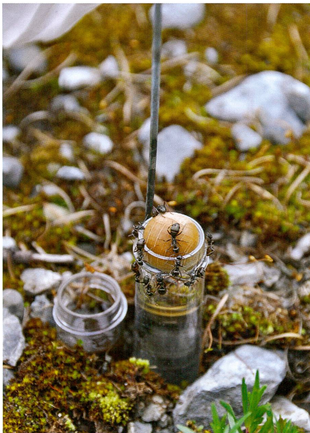
Abb. 12: Zuckerwasserköder mit Ameisen.

Das Hauptaugenmerk der Untersuchung lag auf dem Nestnachweis von Ameisen (Formicidae), welcher für die bodennistenden Arten durch ihre oberflächennahe Aufzucht der Brut innerhalb der Vegetationsperiode vergleichsweise einfach und witterungsunabhängig zu erbringen war. Dazu