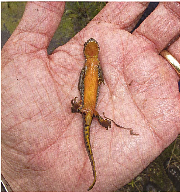
Abb. 15: Bergmolchmännchen in der Val Vau.

Eine Vierergruppe von Reptilien- und Amphibien-spezialisten machte sich bei doch recht kühlen und feuchten Wetterverhältnissen in der Val Mora und Val Vau auf die Suche nach den dortigen Amphibien und Reptilien. Diese ungünstigen Voraussetzungen und die wenigen innerhalb der Projektfläche vorkommenden Arten führten zum erwarteten mageren Ergebnis: Es wurden insgesamt nur fünf Grasfrösche ( Rana temporaria ) und knapp ausserhalb der Projektfläche zwei Bergmolche ( Mesotriton alpestris ), ein Männchen und eine Larve, beobachtet. Damit sind immerhin die beiden im Gebiet vorkommenden Amphibienarten nachgewiesen worden.