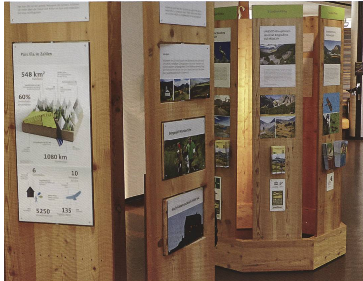
Abb. 3: Die Sonderausstellung «Bündner Pärke – Echte Schätze» informierte über die sechs Pärke in Graubünden und regte zu deren Besuch an.