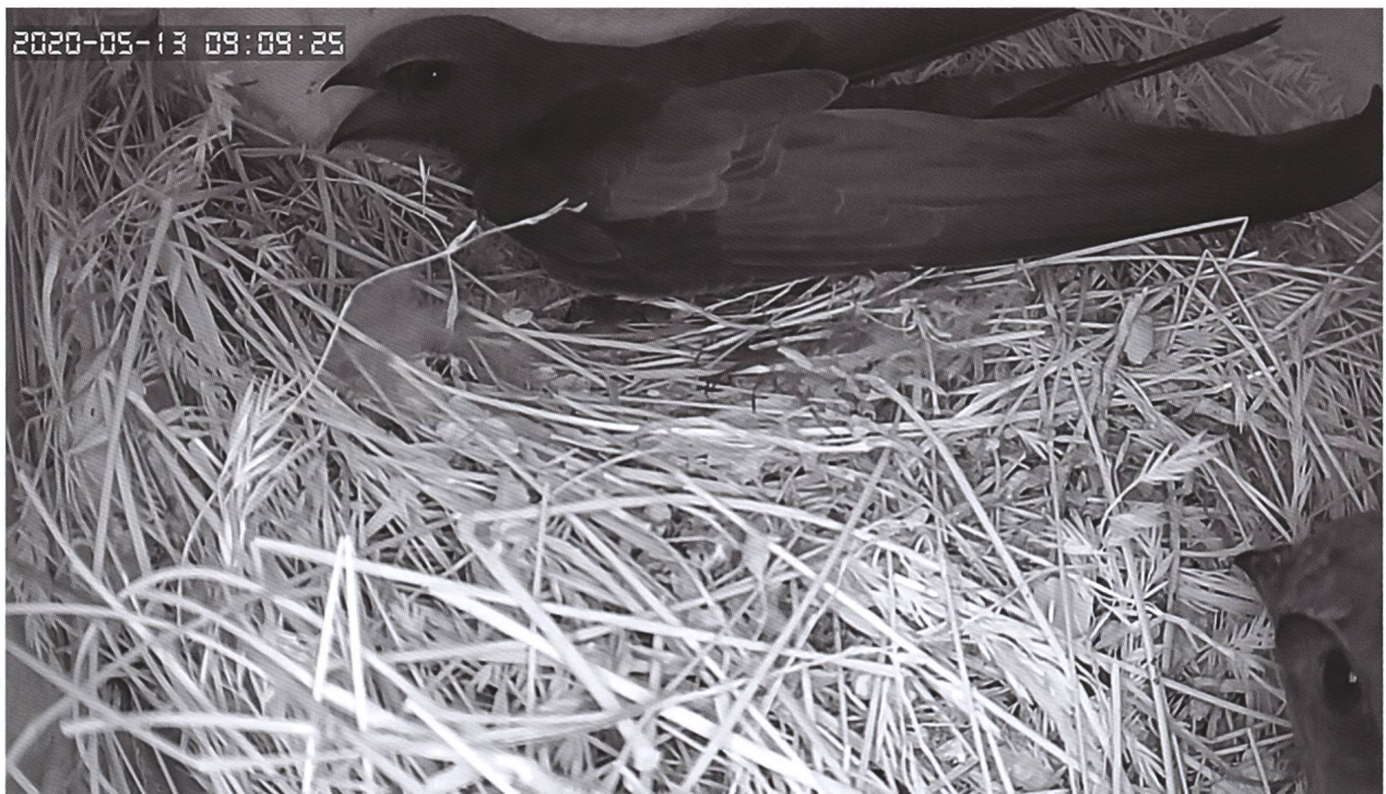
Abb. 2: Das Brutgeschäft eines Mauersegler-Paars liess sich dank einer Direktübertragung im Museum verfolgen.

Wie bereits im Vorjahr brüteten in einem Nistkasten an der Westfassade Mauersegler – dieses Jahr verdoppelte sich der Bestand auf zwei Paare. Über eine Kamera wurde das Geschehen erstmals aus einem Kasten in Echtzeit auf einen Bildschirm im Museum übertragen (Abb. 2). Diese Technik ermöglichte einen eindrücklichen Blick in die Kinderstube dieser Vogelart. Die Besetzung der Bruthöhle, die Eiablage, der Verlust des ersten Geleges aus zwei Eiern und die anschliessende Ablage eines weiteren Eis, der Schlupf des Jungvogels, seine Betreuung durch die Eltern und die Entwicklung seines Federkleids konnten unmittelbar erlebt werden. Nicht wenige «Freaks» kamen beinahe täglich, um die neusten Entwicklungen zu verfolgen. Anfang August flog der Jungvogel aus, nachdem ein Altvogel die Familie schon zuvor Richtung Süden verlassen zu haben schien.