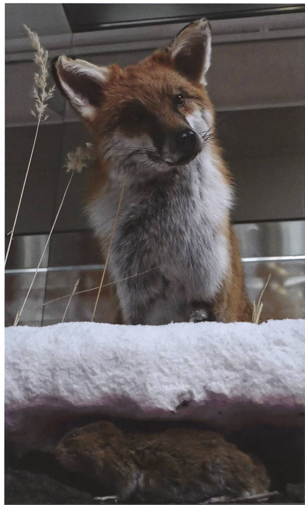
Abb. 1: Der neue Fuchs mit Schermaus ist ein Bijou in den Ausstellungen.

In den Dauerausstellungen wurden bisherige Objekte ersetzt oder restauriert, die qualitativ (insbesondere als Folge des Ausbleichens) nicht mehr den Ansprüchen genügten. Ein Bijou ist ein Fuchs in winterlichem Ambiente, der durch die Schneedecke eine Schermaus ortet. Der Fuchs hat die Maus gehört, kann sie aber nicht sehen. Dies im Unterschied zum Betrachter, der beide Tiere gleichzeitig sehen kann (Abb. 1).