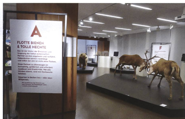
Abb. 4: Die Sonderausstellung «SEXperten – Flotte Bienen und tolle Hechte» gab einen faszinierenden Einblick in die Fortpflanzung im Tierreich. Leider konnte sie im Berichtsjahr nur einen Monat besichtigt werden.

Die Sonderausstellung «SEXperten – Flotte Bienen und tolle Hechte», produziert vom Amt für Umwelt Liechtenstein und dem Liechtensteinischen Landesmuseum, informierte über Partnerwahl und Fortpflanzung im Tierreich (Abb. 4). Zwar konnte die Vernissage am 4. November 2020 planmässig durchgeführt werden, doch ab dem 5. Dezember musste das Bündner Naturmuseum für den Rest des Jahres (und bis Ende Februar 2021) seine Tore erneut schlies-