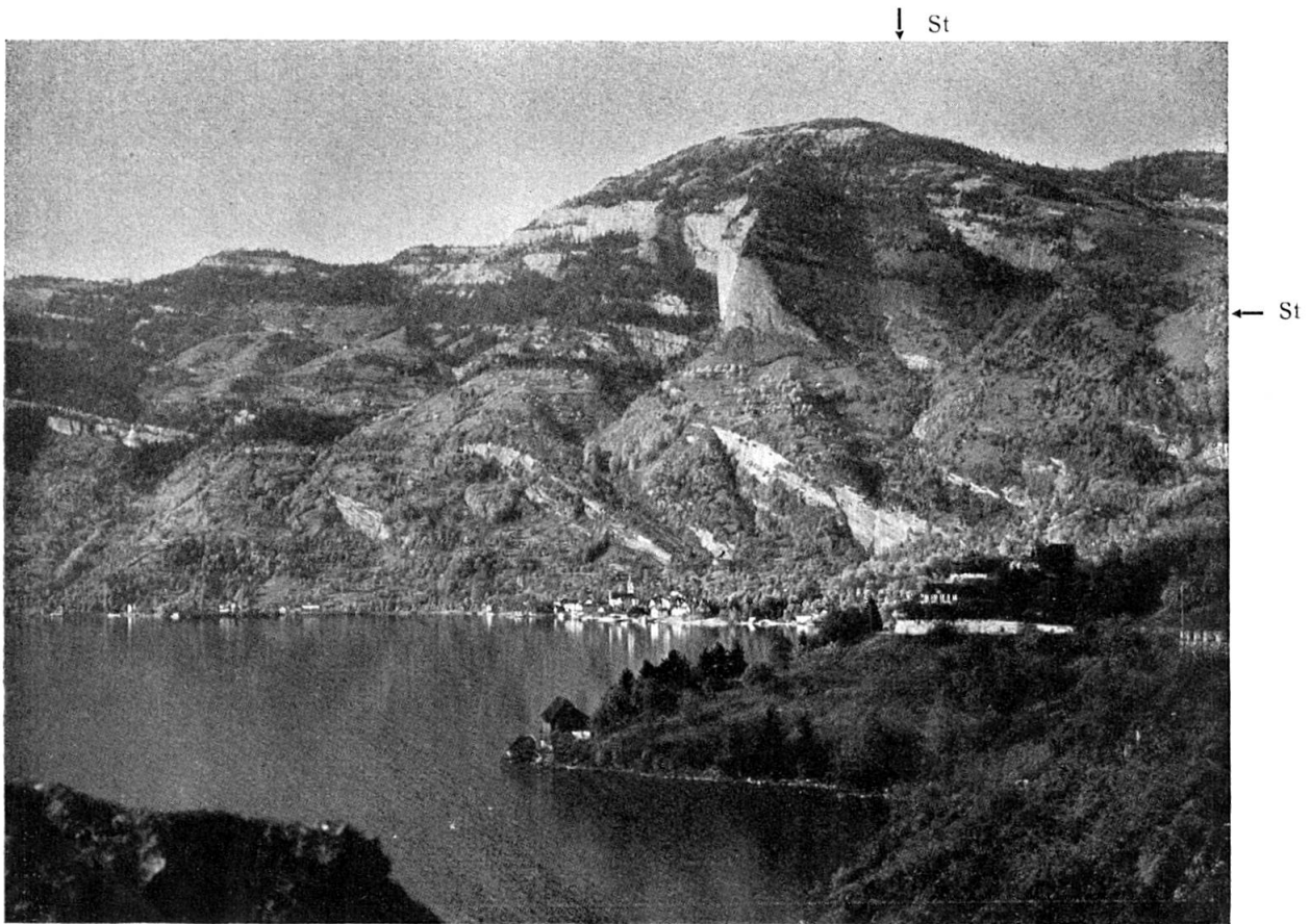
Höhle Steigelfadbalm, Rigi (960 m ü. M.). Menschliche Siedlung aus der letzten Zwischen-Eiszeit.