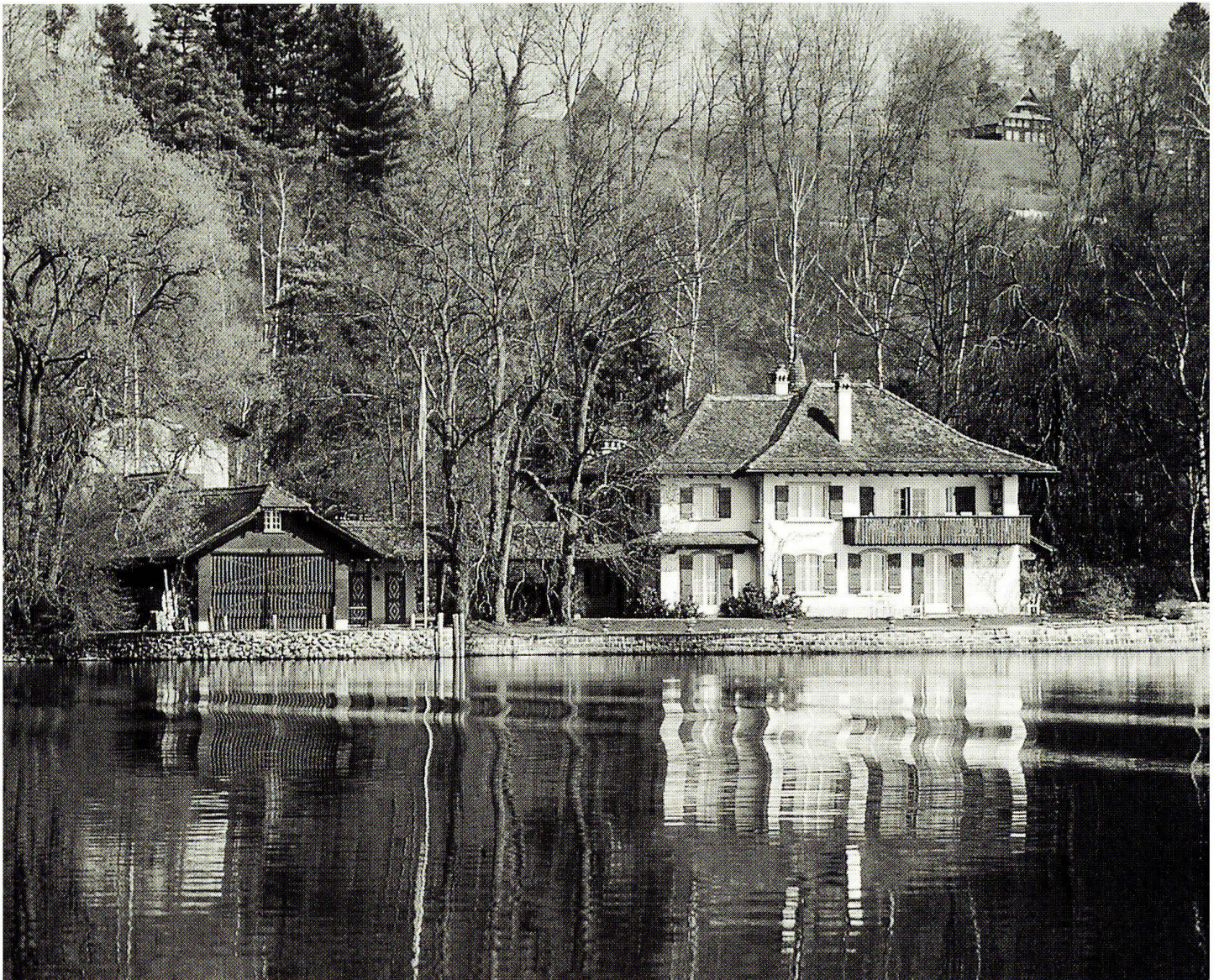
Abb. 6: Hartverbau der Uferlinie im Gebiet Seematte, Sempach.

seits kann eine geringe Diversität auch durch das Überhandnehmen einer an die Verhältnisse optimal angepassten Art verursacht sein. Bei hohem Nährstoffgehalt kann die Unterwasservegetation beispielsweise durch eine einzelne Laichkraut-Art zunehmend dominiert werden, was auch am Sempachersee zu beobachten ist.