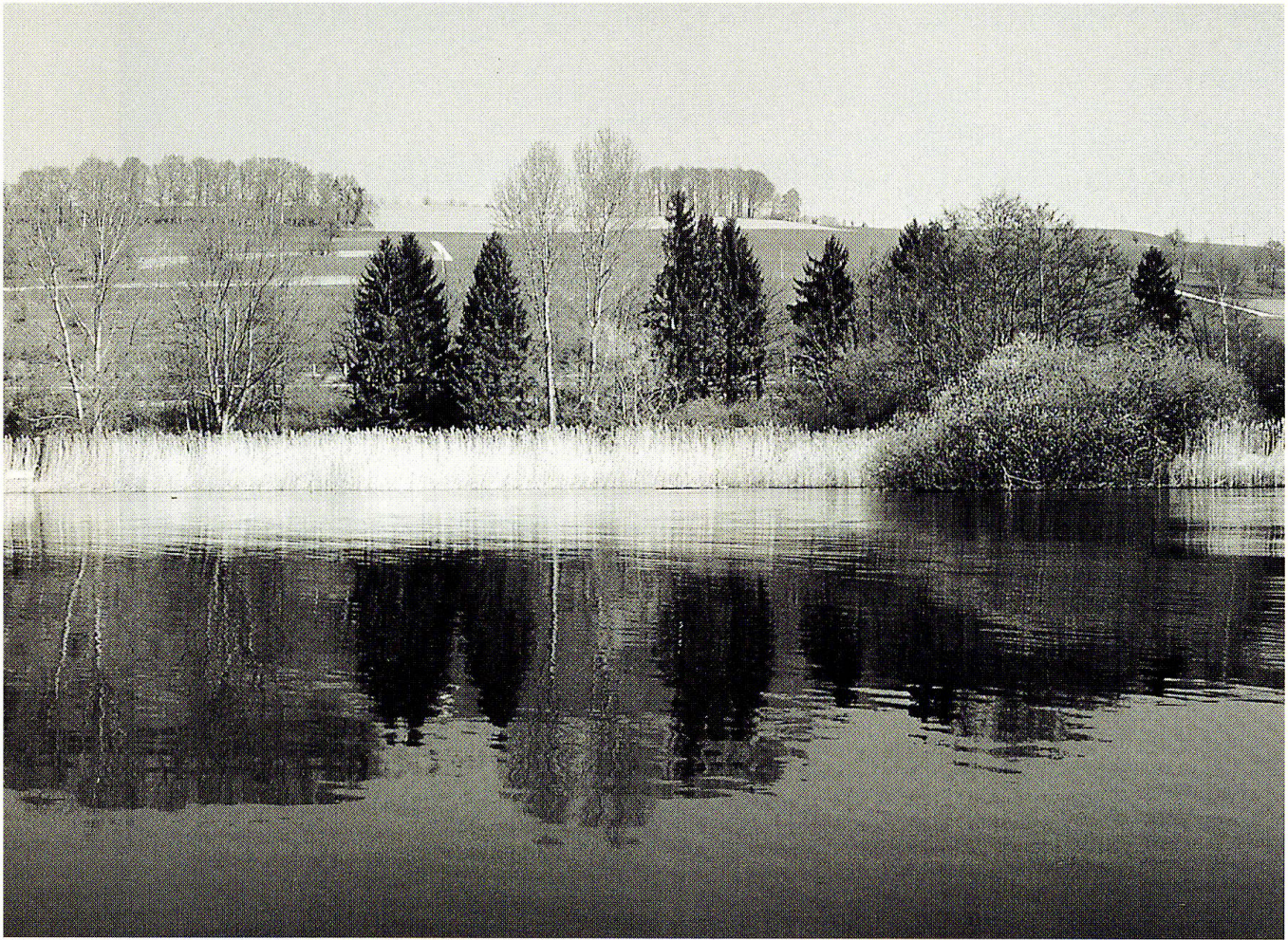
Abb. 1: Intakter Uferstreifen bei der «Gänsesägerbucht», Gemeinde Eich.