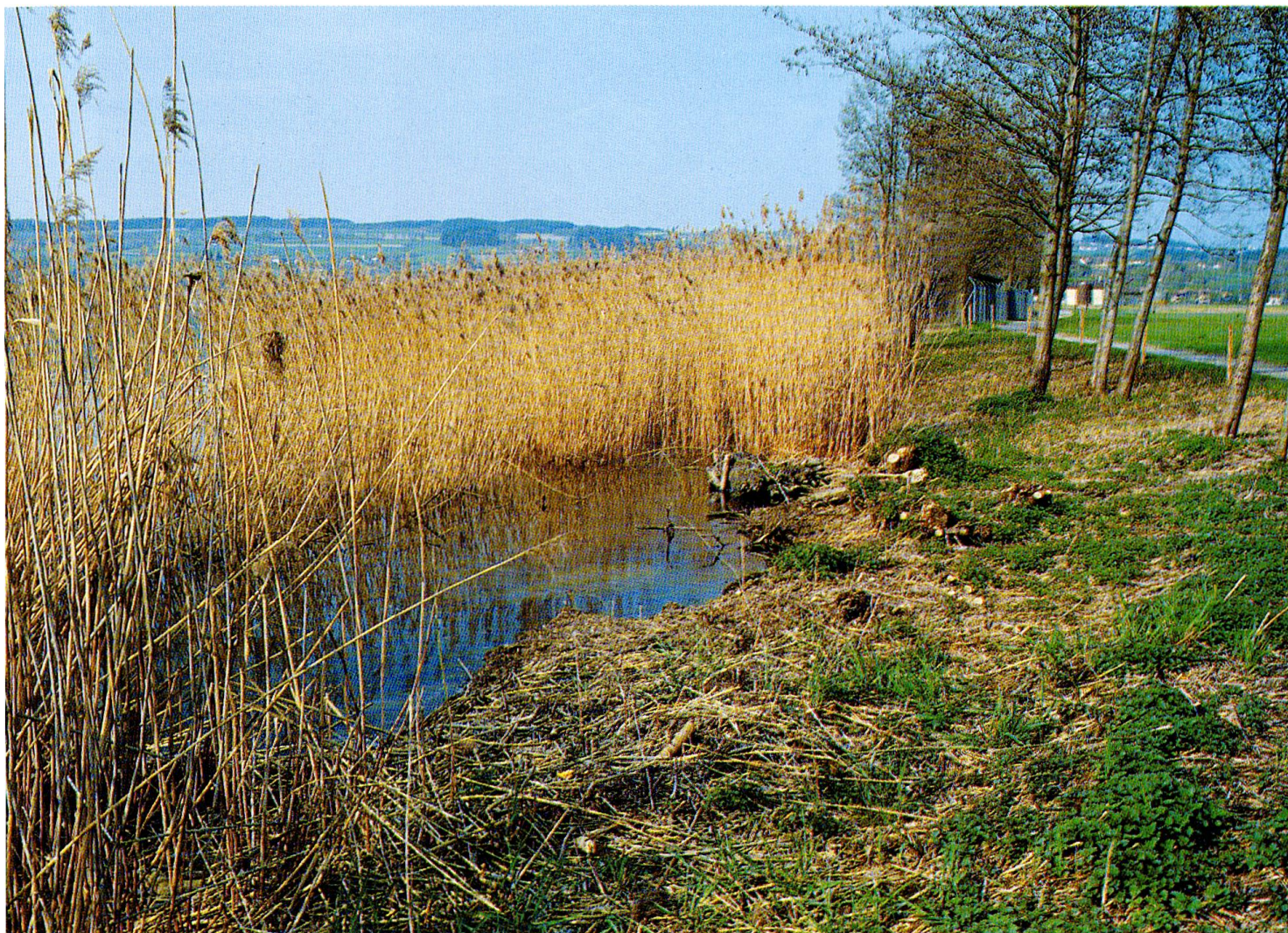
Abb. 10: Mit lokalen Pflegemaßnahmen, wie Ausdünnen des Gehölzesaumes, kann die bestehende Raum- und Lichtkonkurrenz zwischen Baumbestand und Röhricht behoben werden.

Dieser Uferabschnitt muss mit ingenieurbiologischen Massnahmen vor weiterer Erosion geschützt werden. Den besten langfristigen Erosionsschutz bildet ein flacher Land-Wasser-Übergang mit einem vorgelagerten, das Flachwassersediment stabilisierenden Schilfbestand.