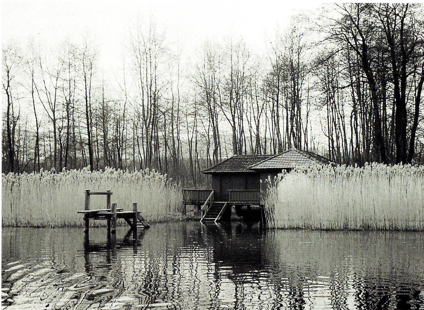
Abb. 4: Bootshaus auf Gemeindegebiet von Oberkirch. Mit der Beanspruchung von Seefläche im Uferbereich wird der bestehende Schilfgürtel deutlich zertrennt.

serlinie nur beschränkt durch Erschließung und Verbauung beeinträchtigt ist. Schilfröhrichte oder Kiesstrände sind einzeln bis ausgedehnt vorhanden. In den Pflanzenbeständen sind mindestens drei Arten oder für den See seltene Arten vertreten.