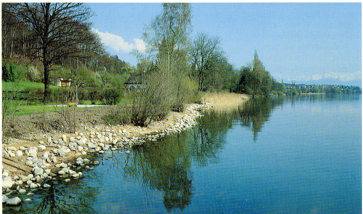
Abb. 9: Blick auf denselben Uferabschnitt im Gebiet Seematte, Gemeinde Sempach. Vor der Sanierung (oben) war ein schmaler, lückenhafter Binsenbestand und ein im Wurzelbereich unterspülter, dichter Gehölzesaum vorhanden. Durch Ausdünnen des Baumbestandes, Abflachen des Überganges Land-Wasser sowie mit Pflanzungen von Schilf soll wieder – wie vor wenigen Jahren noch vorhanden – ein geschlossenes Röhricht vor der Parzelle hergestellt werden (Bild unten nach den Sanierungsmaßnahmen, Blick vom Bootshaus).