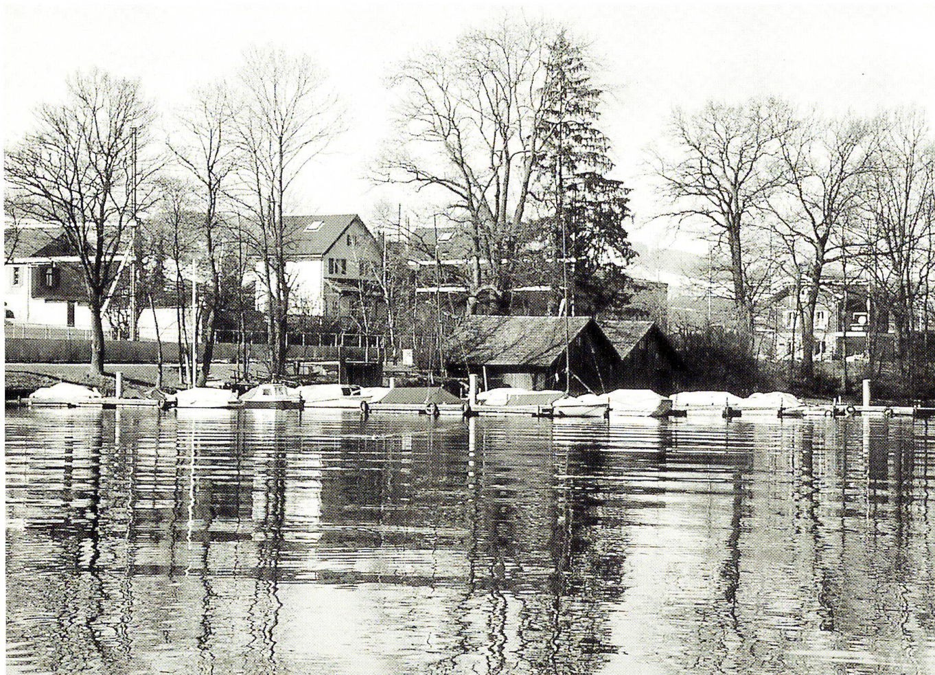
Abb. 3: Bei Bootshäfen, hier bei Nottwil, ist die private Erholungsnutzung des Ufers besonders intensiv.

«Weitgehend naturbelassene Ufer» sind heute an rund 6,5 km oder 34 % des Seeumfanges vorhanden. Lediglich 3 % (0,6 km) sind vollständig künstlich, bestehen also aus Blockwurf, Steinmauern, Betonmauern, Spundwänden und ähnlichem (Abb. 6).