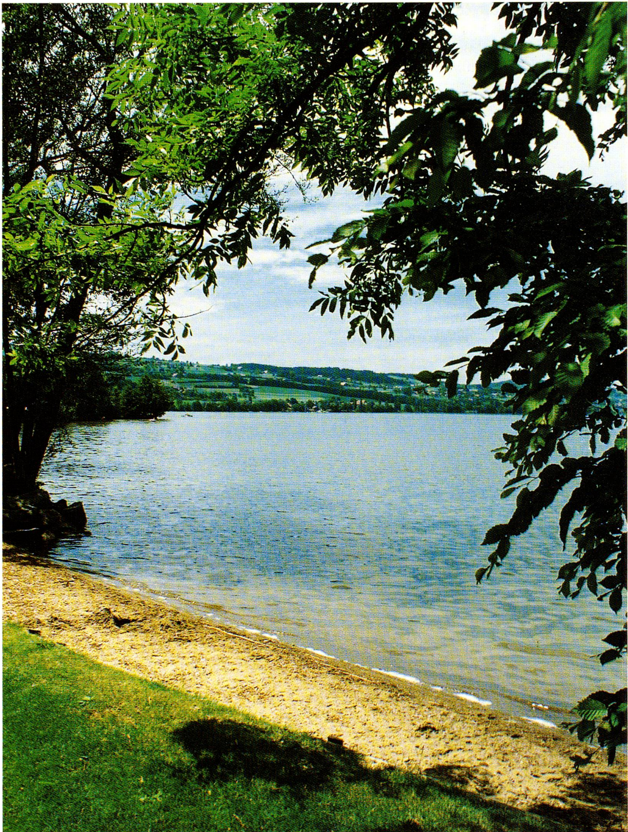
Abb. 7: Eines der wenigen Sandufer am Sempachersee bei Neuenkirch. Es dient als Badestelle für Pferde («Rossbadi»).