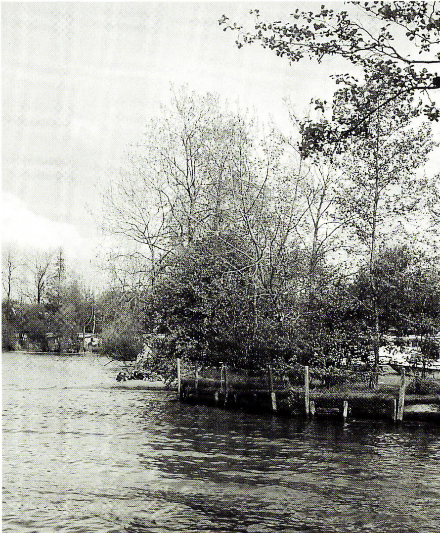
Abb. 8: Hartverbau der Wasserlinie mit Holzpalisaden gegen fortschreitende Ufererosion bei der Mündung der Grossen Aa.

Voraussetzungen kann mit minimalen Mitteln und Eingriffen der Zielwert mit möglichst geringem Aufwand erreicht werden.