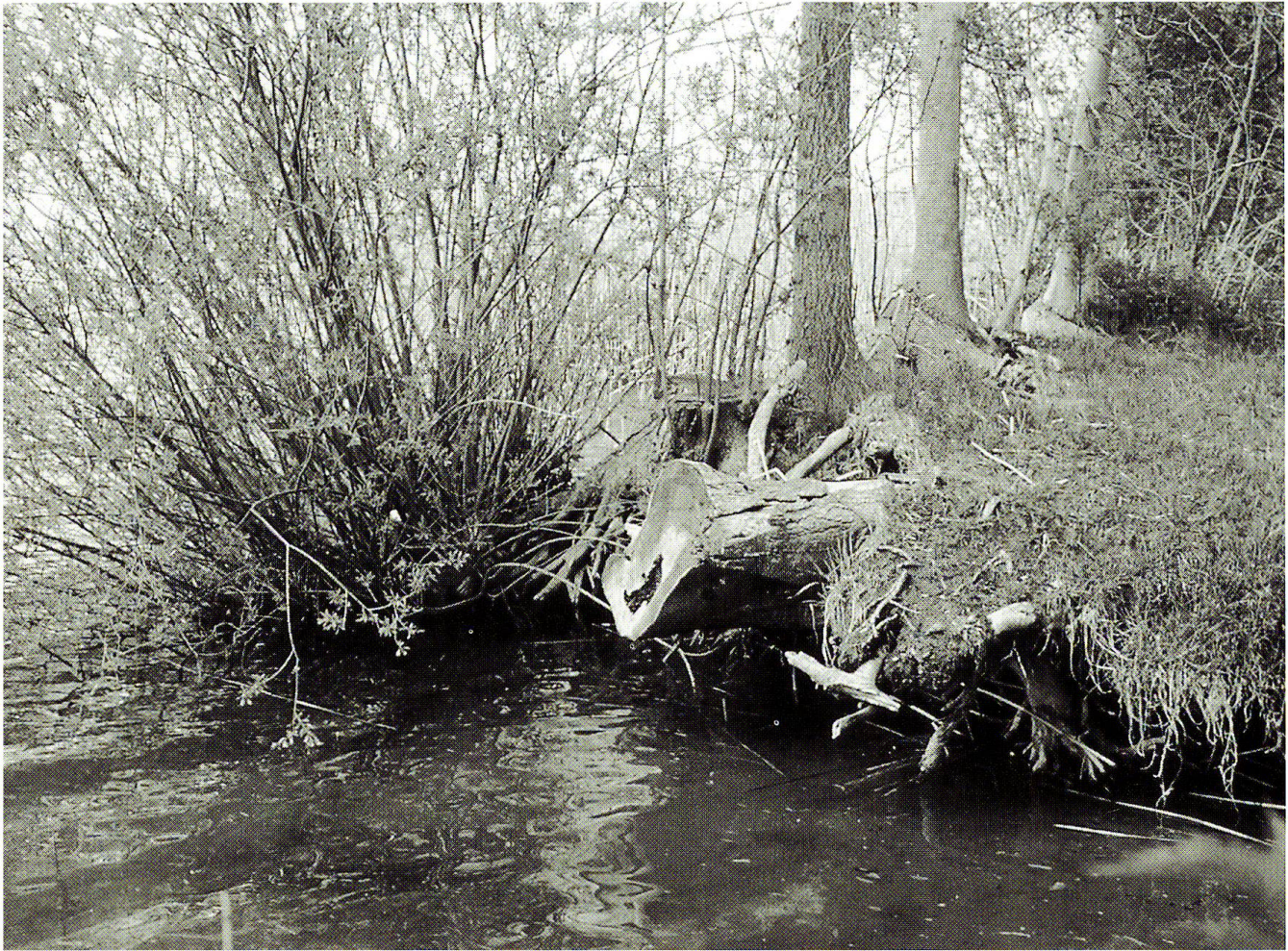
Abb. 11: Zeichen von starker Ufererosion bei der ARA Sempach-Neuenkirch, unmittelbar angrenzend an die ausgedehnte Röhrichtfläche bei der Mündung der Grossen Aa. Ein vorgelagerter, das Ufer stabilisierender Schilfbestand fehlt in diesem Bereich.

Röhricht aus vitalen Beständen an der Wasserlinie sind denkbar. Wo Lichtkonkurrenz mit dem Baumbestand besteht, muss dieser gelichtet werden.