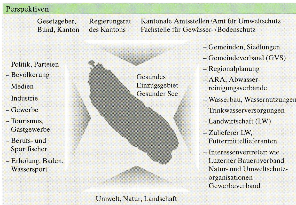
Abb. 1: Perspektiven bei der Gesundung des Sees und seines Einzugsgebietes.

Massnahmen zu erreichen war. Mit der Gründung des Gemeindeverbandes Sempachersee wurde wahrscheinlich das erste Mal einer öffentlichen Körperschaft die anspruchsvolle Aufgabe übergeben, ein Gewässer als Ökosystem in einen gesunden Zustand zurückzuführen.