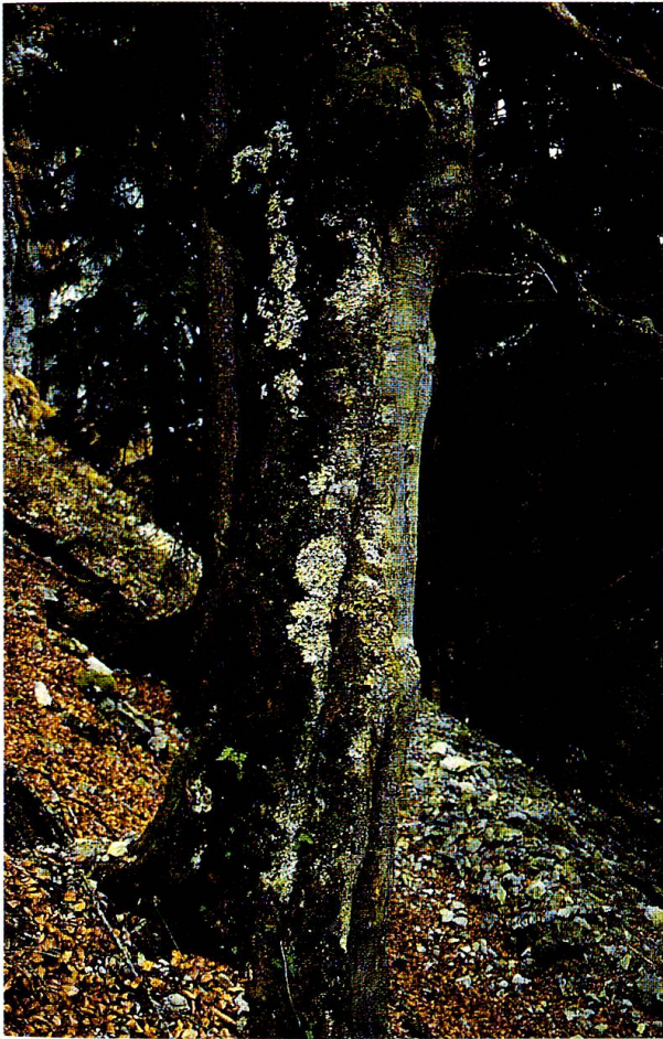
Abb. 4: Standort von Lobaria amplissima im Wägital. Sie wächst hier auf alten Buchen in lichtem Wald.