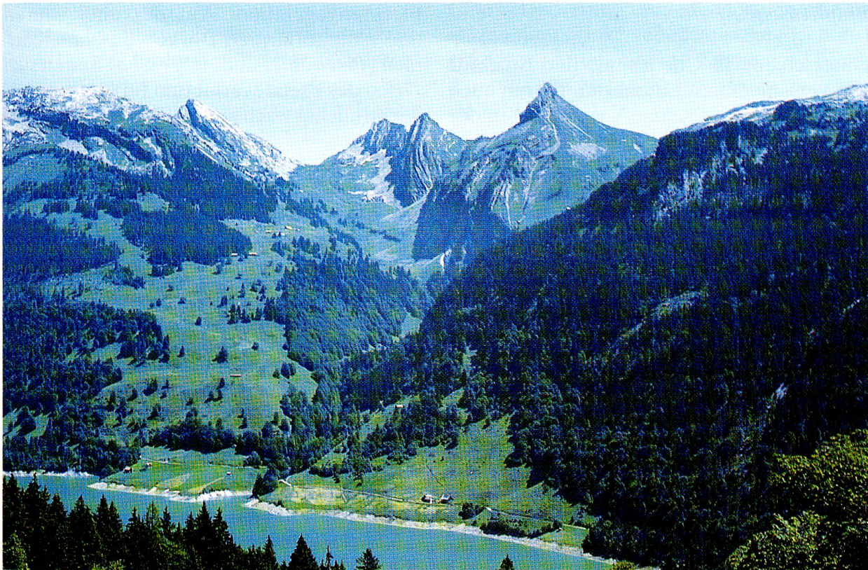
Abb. 2: Blick über den Wägitalersee zum Zindlenspitze (2097 m ü. M.). Die extensiv bewirtschafteten Mischwälder bilden ein Rückzugsgebiet für viele bedrohte Flechtenarten.

vielseitige Wander- und Skitourengebiet. Auf Wanderungen im Gebiet des Wägitalersees gemachte Funde seltener Flechtenarten waren denn auch Auslöser für genauere Betrachtungen der Flechtenflora. In einem ersten Schritt wurden die Makroflechten (Blatt- und Strauchflechten) im oberen Teil des Wägitals erfasst.