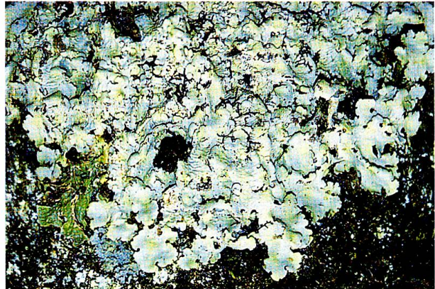
Abb. 5: Lager von Lobaria amplissima mit den charakteristischen Auswüchsen von Dendriscoaulon umhausense .

(Fruchtkörper). Hingegen traten die für die Art typischen schwarzen Auswüchse, auch Cephalodien genannt, auf (Abb. 5). Diese entstehen, wenn Pilzfäden von Lobaria amplissima statt mit einer Grünalge aus der Familie der Chlorococcaceae mit Cyanobakterien der Gattung Nostoc eine Symbiose eingehen. In diesem Falle bilden sich auf dem Thallus die schwarzen, reich verzweigten, zwergstrauchigen Lager von Dendriscoaulon umhausense . Die Art kommt mitunter auch unabhängig von L. amplissima vor, wurde im Wägital aber nur zusammen mit dieser gefunden. Neben vital aussehenden Thalli weisen viele Exemplare von L. amplissima Verfärbungen und mechanische Schadsymptome auf.