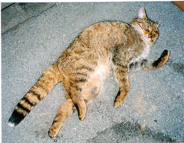
Die tot gefundene Waldkatze: typisch sind das verwachsene, nur undeutlich gestreifte Fell und der gegen das buschige Ende hin stark geringte Schwanz.

Gleich neben der Staatsstrasse T5, zwischen Oensingen und Oberbuchsitzen im Kanton Solothurn, im Bereich Hagenacher, fand einer der Autoren (D.P.) am 3.1.1997 um 14.30 Uhr eine tote, erkaltete, aber noch gut erhaltene Katze. Mit der Vermutung, es könnte dieses Opfer des Strassenverkehrs eine Wald- oder Wildkatze betreffen, leitete er sie gleichentags an das Naturmuseum Solothurn weiter. Von dort gelangte sie zur Abklärung der Artzugehörigkeit an das Naturhistorische Museum Bern und schliesslich zur Aufbewahrung in das Naturmuseum Olten. Die Messungen an den Eingeweiden und am Skelett bestätigten die auf den äusseren Merkmalen basierende Vermutung des Finders, dass es sich um eine Waldkatze handelt. Die Indizes von Darmlänge/Körperlänge und Hirnschädelvolumen/Schädellänge liegen beide klar im Bereich von Felis silvestris (Kasten).