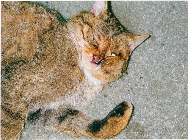
Die verheilte Verletzung im Schnauzenbereich fällt sofort auf.

lichste uns bekannte untersuchte Fund einer toten Waldkatze seit der Mitte des 20. Jahrhunderts (LÜPS 1995). Er liegt rund 17 km weiter gegen Südosten verschoben als die zum damaligen Zeitpunkt als einigermaßen sicher geltenden Feldbeobachtungen im selben Zeitraum (25.3.1990, Blattner briefl.).