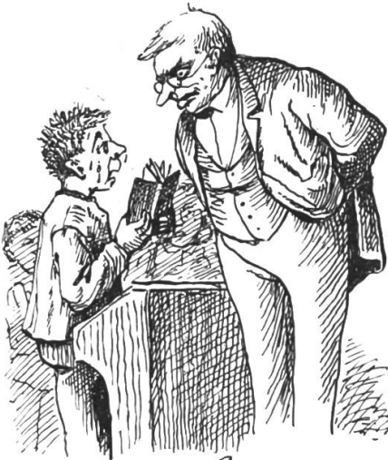
In der Prüfung.