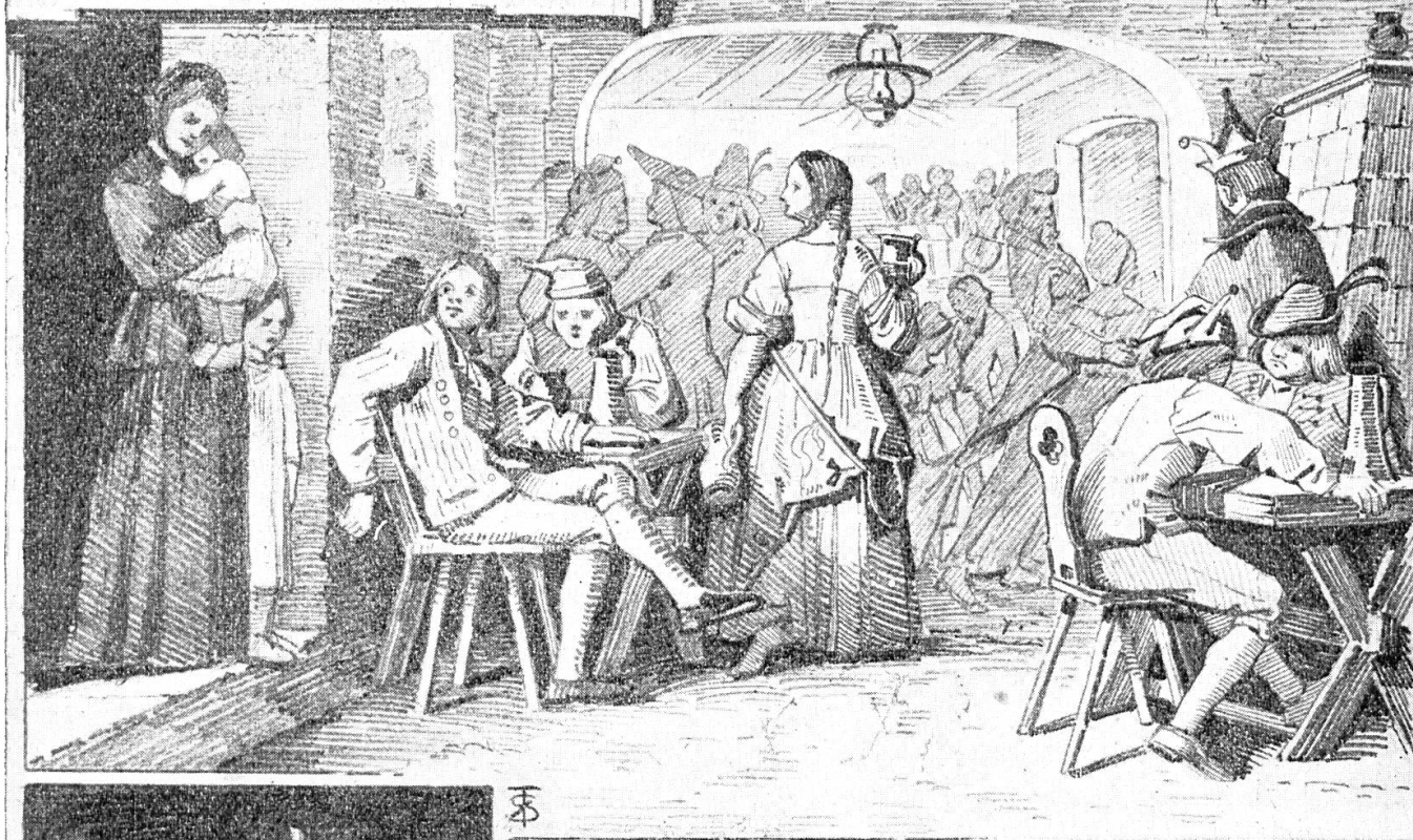
In der Saaltür stand ein Weib