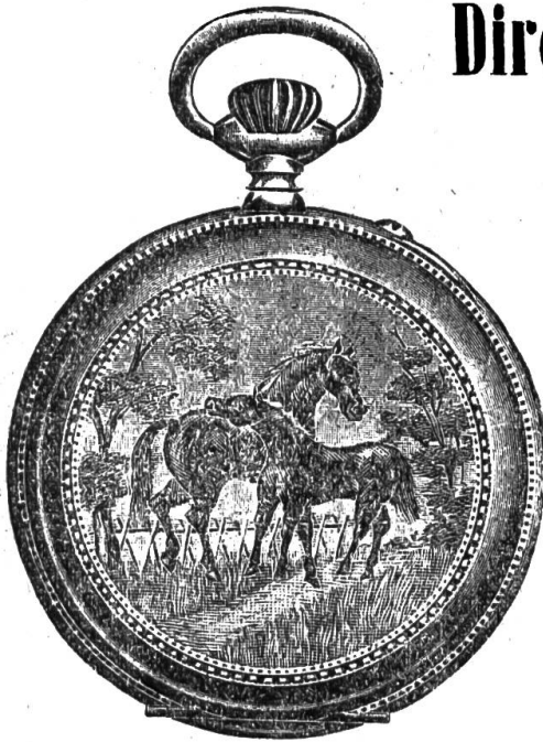
1a. Silber-Anker-Rem. 8 Rub. mit Goldrändern