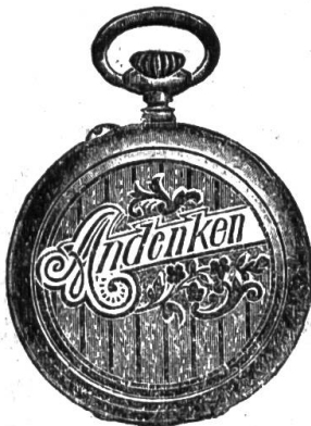
1a. Silber-Cylinder-Rem. 10 Rub. mit Goldr.