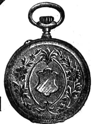
1a. Silber-Cylinder-Rem. 10 Rub. mit Goldr.