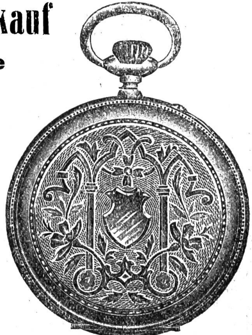
1a. Silber-Anker-Rem. 8 Rub. mit Goldrändern