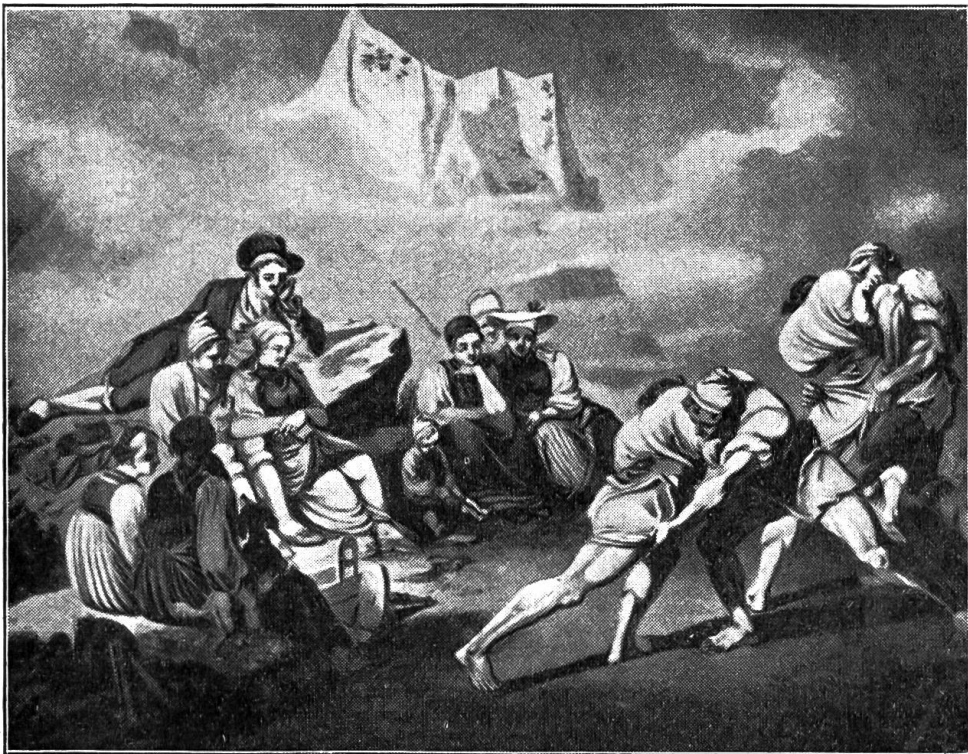
Helferschwinget. Nach einer Lithographie von J. Volz.

Diesmal schaute er alles so klar und lustig aus der Höhe herab an. Die paar Stümpchen von Menschen auf dem grünen Bödeli unten, — zwei, drei Firsten, die nicht mehr Firsten zu nennen waren. Ein par Leute winkten, ein Knecht schwang die