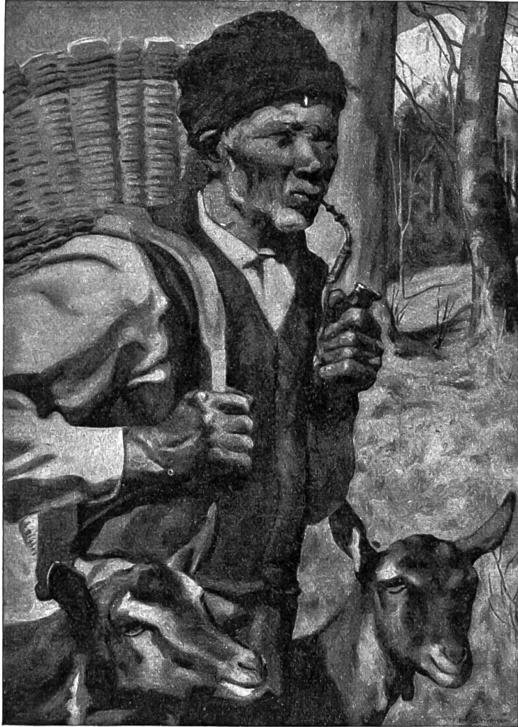
Der Geißpeter. Gemälde von Hans Widmer.

Mund zu einem Pfeifen und trampete mit großen Schritten in die Stube hinaus. Er hatte ein gezwungenes Lächeln auf der Zunge und ein Wort: — was wird er sagen? Alle schauten ihn an. Er ruzte: „Auf jetzt! wieder ans Holz! Die Täg ergeben nicht wohl.“