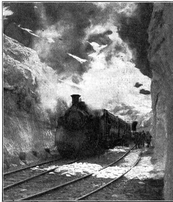
Zur Eröffnung der Furlabahn.

heran, her und wieder weg, so nahe, daß es knisterte von seinem Flügelschlag und schattnete, als ob die Sonne maugle. Toni schaute weg, wollte ihm mit dem Auge folgen, — da saufte — o Herr und Gott — schon der leere Wagen herauf. Bremsen, bremsen, bremm . . . ! Mit aller nur erdenklichen Kraft stemmte er sich gegen das Rad, aber die Karren waren gewalttätiger, die Seile rechthaberischer als Tonis Hand. Ein harter böser Aufschlag erfolgte. Viel, viel härter als heute morgen, wo der Dolden brach. „Ist etwas kaput?“ So erwachte Toni aus