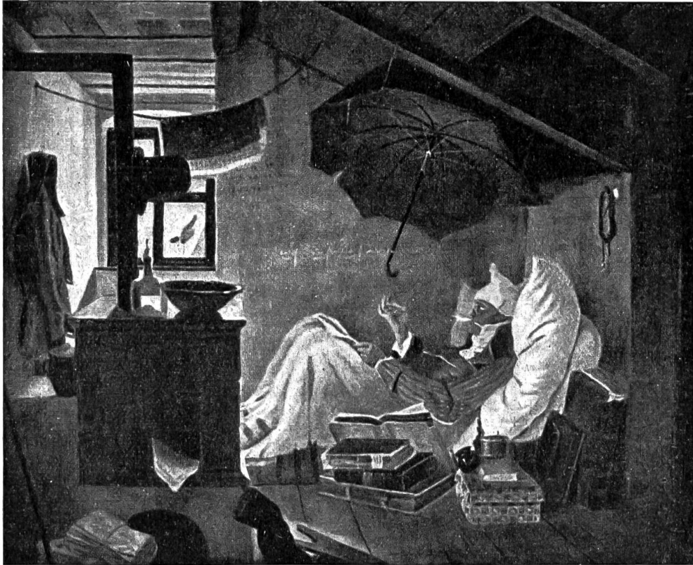
Der arme Dichter. Nach dem Bilde von C. Spitzweg.

Der Drahtseil schmied war ein kleiner breiter Mann mit einem festen Tellenkopf. Sah man den Mann an einem Tisch sitzen, so dachte man: welch ein Riese; stand er aber auf, so hatte er nur kurze Beine und war klein. Aber das schöne männliche Ge-