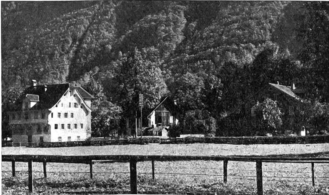
Bisheriges Waisenhaus (links) und ehemalige Dechwanden-Anstalt (rechts).