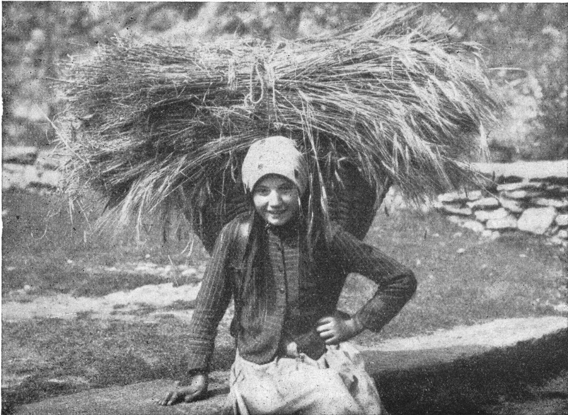
Kleine Walliserin bei der Kornernte

Das sind noch einige bestehende Einrichtungen im Walliser Gemeinschaftsleben. Doch gibt es daneben noch weniger dauerhafte Gemeinschaftsgebilde: so um den in einem Dorfteil gemeinsam gebauten Brunnen herum; oder um eine Weinpresse, die der Reihe nach von den Dorfbewohnern benützt wird. Aber diese Dinge sehen auf keine Tradition zurück; sie haben keine Geschichte.