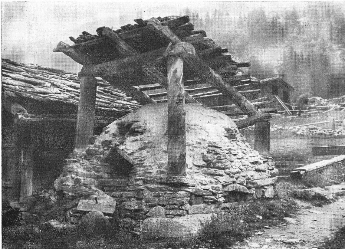
Alter Gemeinde-Backofen in einem Walliser Bergdorf

Im Frühling rufen die „Bisses“ (die Bewässerungskanäle). Jeder kennt die schmalen Gräben, die den Hängen das befruchtete Wasser zuführen. Sie sind Gemeinschaftsgut aller Bodenbesitzer. Sie ernennen einen Verwalter, der die Verteilung des Wassers und die Arbeit am „Bisse“ zu regeln hat. Im Frühjahr ruft er alle, die in den Urkunden eingetragen sind zusammen. Es ist Zeit, die Wasserleitung von allem angestau-