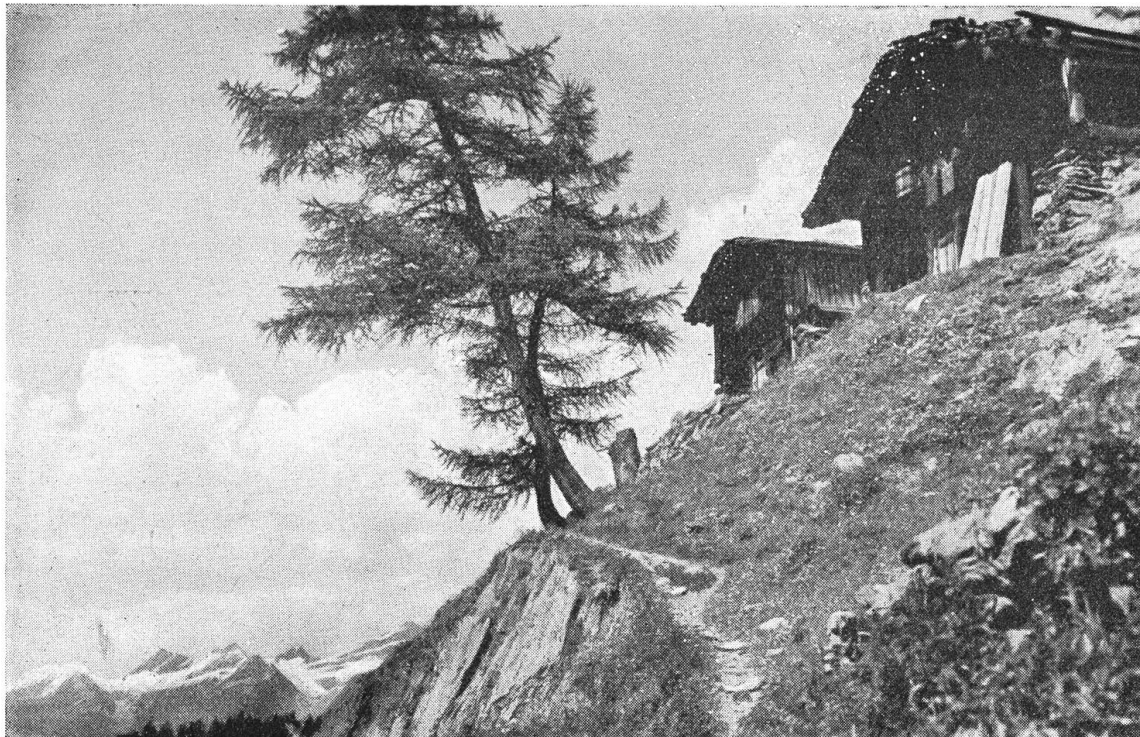
Auf der Gletscheralp im Lötschental