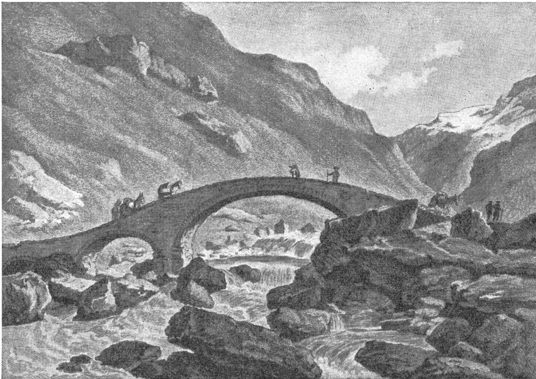
Reußbrücke oberhalb Göschenen nach einem alten Stich

li oder seiner jungen Frau Seide aus der Lombardei für eine hoffärtige Trachtenschürze, ein Halsbätti, eine Chralle (von Koralle) oder goldene Ohrgehänge. Später war es gang und gäb, ein seidenes Schultertuch zu kramen in einer hübsch bemalten Spanischachtel. In Nidwalden trugen die halbherrischen Jungfern (die mit weißen Rüpfen) das „Mailänderli“. In Obwalden ist es bei den Trachtenmeitschi immer noch gebräuchlich. Und weil dies in Mailand ge-