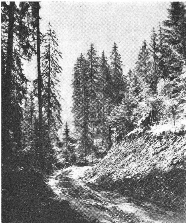
Waldstraßenbau ermöglicht eine rationelle Nutzung auch im Gebirgswald

Behaglichkeit und Wärme mit dem einheimischen Holz — soll Devise sein im Nidwaldner Haus!