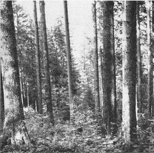
Einer unserer schönsten Gebirgsfichtenbestände

Der Besucher, der mit seinem Auto unsere Gegend bereift, wird Nidwalden als typischen Laubholzkanton taxieren. Erst wenn er sich die Mühe nimmt, die Steilstufe zu überwinden und die weiten Seitentäler mit ih-