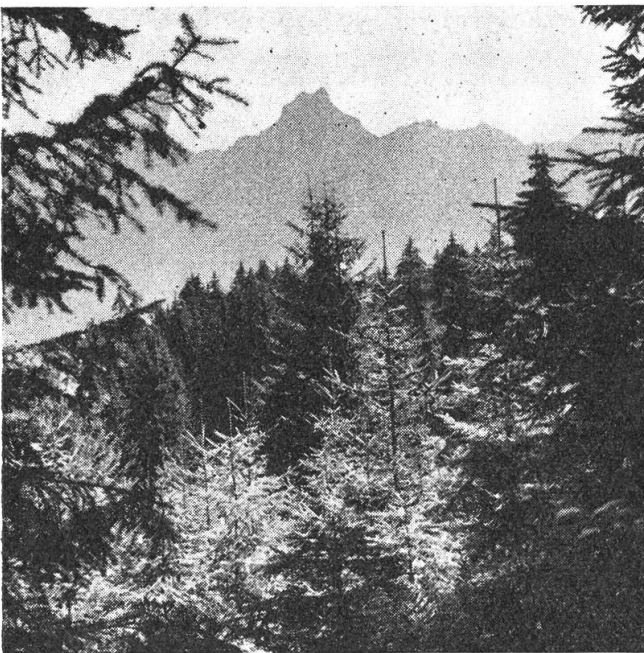
Aufforstung im Gebirgswald

Der Wald ist heute vor allem auf jene Gebiete zurückgedrängt, die zufolge ihrer Steilheit, ihrer Schattenlage oder wegen dem schlechten, nassen oder steinigem Boden eine landwirtschaftliche Nutzung nicht zuließ, oder unwirtschaftlich und unrentabel wäre. Viele der Waldgebiete würden ohne Baumbestockung zu unproduktivem Boden. Wir dürfen deshalb die Produktionsfähigkeit dieser Ge-