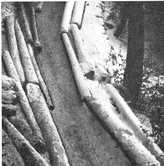
Früher üblicher Transport in einer „Holzverleggi“

Holzernte und des Transportes hat sich in den typischen Holzerfamilien vom Vater auf den Sohn, in den Holzerguppen vom erfahrenen Meister auf seine jüngeren Gehilfen vererbt und übertragen. Wir wollen alles daransetzen, daß uns dieser hoch entwickelte Berufsstand erhalten bleibt, daß sein guter Ruf zu Recht bestehen wird und immer wieder junge, kräftige, arbeitswillige Burschen sich diesem harten, aber stolzen Berufe in der freien Natur, in unserem schönen Walde, zuwenden werden.