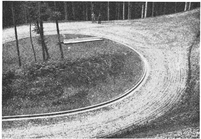
Moderner Waldstraßenbau

Nachdem wir nun verfolgt haben, wie das Holz von seinem Standort im Walde auf den Verkaufsplatz im Tal oder an der Waldstraße gelangt, wollen wir das Schicksal des Holz-